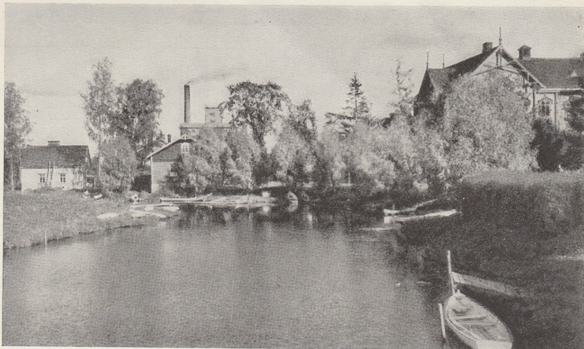
Seurahuoneen idyllinen joenranta

Seurahuoneen rakentaminen oli erittäin viisas sosiaalinen, erikoisesti työväen viihtyisyyteen tähtäävä toimenpide. Yhtiön johto katsoi — ja aivan oikein — seurahuoneen muodostuvan ennakoita estäväksi tekijäksi ala-arvoista ja turmelevaa ajanviettoa vastaan tarjoamalla tilaisuuden kohottavaan ja jalostavaan oma-aloitteiseen toimintaan. Kun ottaa huomioon, että suppea tehdasyhdyskunta, varsinkin jos se on niin pieni kuin se oli seurahuoneen syntymisen aikana, muodostaa kiinteän kokonaisuuden, jossa sen jäsenet ovat jokapäiväisen työn yhdistäminä kosketuksissa toistensa kanssa, niin on ymmärrettävää, että kaikki tavalla tai toisella tempautuivat mukaan siihen toimintaan, joka tarjosi ihanteellisille harrastuksille ja erilaisille henkisille taipumuksille kehittymismahdollisuuden. Seurahuone tuli muodostumaan innoittavan toiminnan keskuksiksi suuremmissa määrin, kuin sitä suunniteltaessa osattiin aavistaakaan. Ei olekaan kummeksittavaa, että vanhojen tervakoskelaisten kauneimmat muistot ja voimakkaimmat elämykset liittyvät seurahuoneeseen.