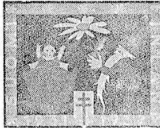
TÄMÄN VUODEN JOULUMERKKI.