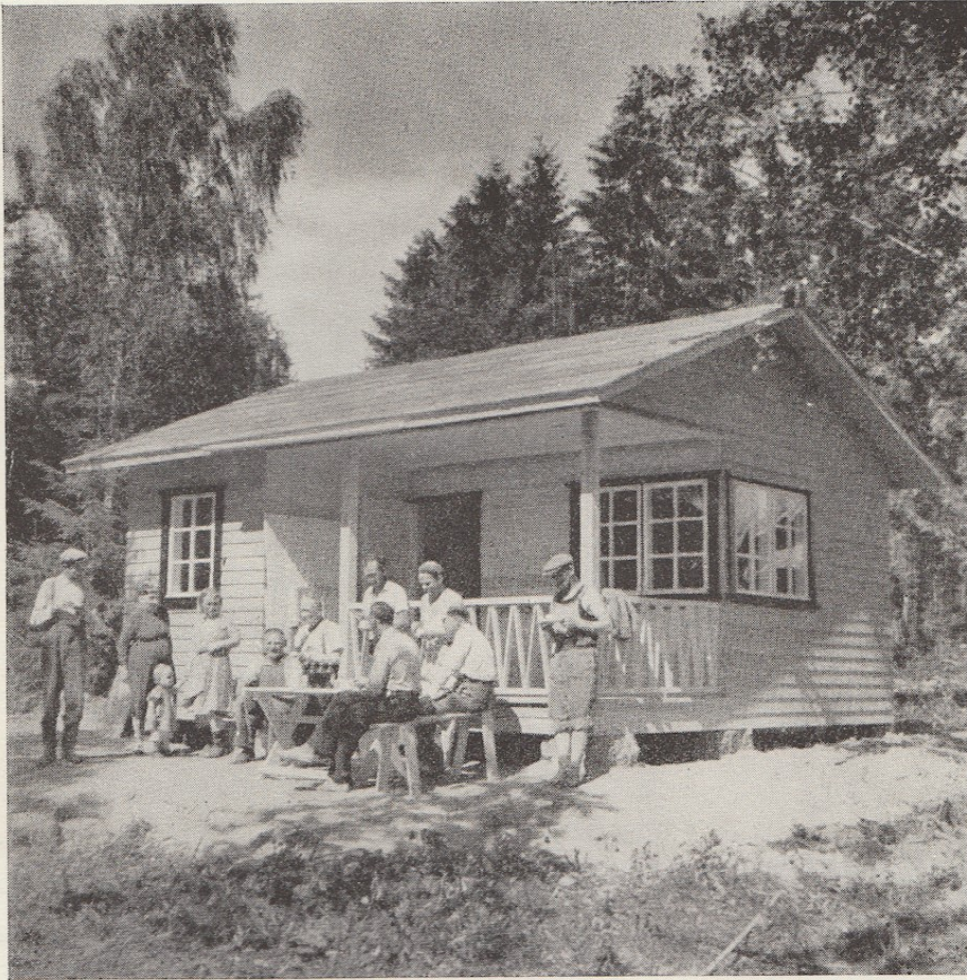
Eräs työväen kesämaja

maksamien sairauskorvausten valvonta ja edelleen tapaturmatorjuntatyössä esiintyvien kirjallisten töiden ym. osatehtävien suorittaminen. Tervakoskella onkin kiinnitetty suurta huomiota tapaturmatorjuntaan. Asian edistämiseksi perustettiin jo vuonna 1933 erikoinen elin, tapaturma- ja huoltokomitea. Siihen tuli kaksi jaostoa, toinen maa- ja metsäosastoa, toinen tehdasta varten. Vuonna 1945 komitean nimi muutettiin Tervakoski Oy:n työturvallisuustoimikunnaksi. Tapaturmatorjuntatoiminnan ohjelmaan on kuulunut ensiapukaappien asettaminen eri osastoille, ensiavun antajien kouluttaminen kurssien avulla, koneitten varustaminen suojalaitteilla tapaturmien varalta, pyrkimys parantaa työpaikkojen terveydellisiä oloja sekä lisäksi valistustyö tapaturmien estämiseksi.