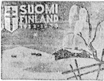
VUODEN 1932 JOULUMERKKI.