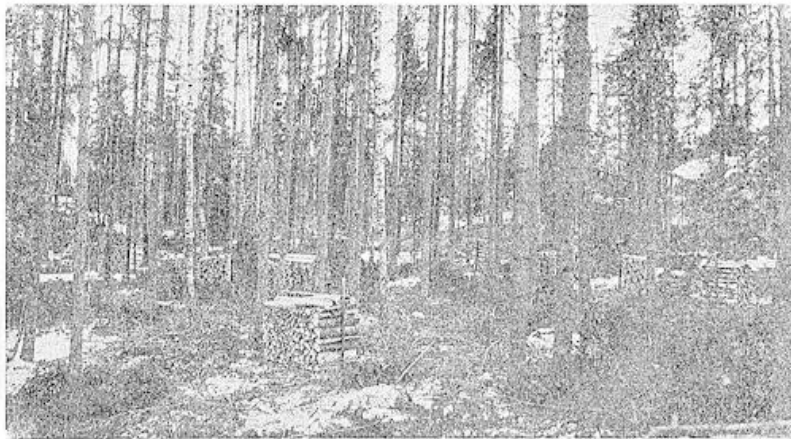
Kivimäen maa tämän vuoden tukinkaadon jälkeen.

Kuusipuu hakattiin ennen haloiksi mutta nykyään saadaan siitä massatehtaiden raaka-aineena huomattavasti korkeampi hinta. Maailman kuusimetsävaras-