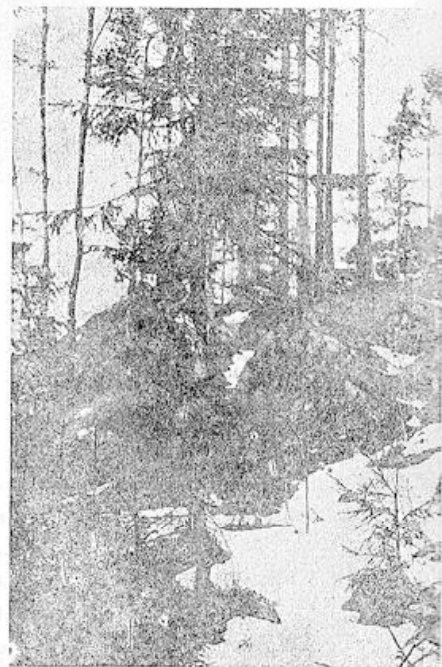
Kuusi, joka on jätetty orjalta alaltansa vuosikymmenisen jälkeen korvaamaan alansa arvon, on auttamattomasti tuhoitu porrashavuiksi. Kallista porrashakoja.

Tehtaan lähimetsissä tehdään vuosittain suurta vahinkoa nuorissa kuusikoissa repimällä niistä oksia porrashavuiksi. Tämäntapainen nuoren puun kohtelu aikaan saa „vertavuotavia” haavoja, jotka hidastuttavat sen kehitystä ja aikaansaavat puussa mätänemisen alua. Tästä lähin tullaankin kartanon puolesta hankkimaan kuusenhavut kaikille kylän asukkaille, josta lähemmin myöhemmin. Samoin tullaan myöskin vapaasti tuomaan juhannuskoivut kylälle, muuten ei ole takeita siitä, että kaunein koivu jää metsään ja heikoin tulee kuistin piele-