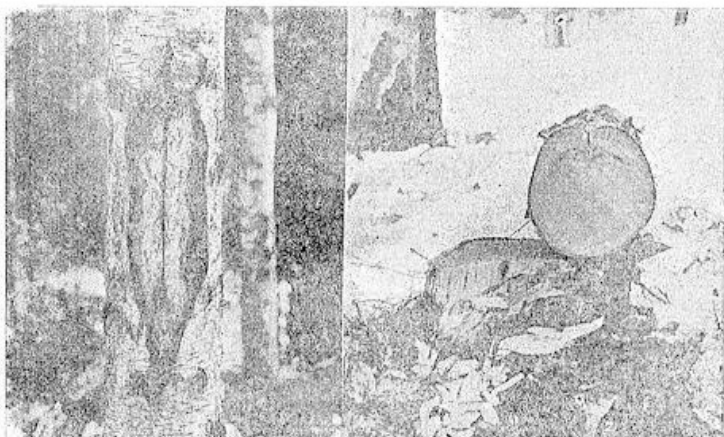
Vasemmalla puukolla piirto annettu koivulle noin 15 vuotta sitten, oikealla tuhoisa seuraus.

Nyt tulee ajattelematon ohikulkija, joka oksia raastamalla tai puukollansa kuorta vahingoittamalla tekee nuoren puun jäkiksi rammaksi. Puulle varattu alue ei siis ole ollut niin tuottoisa, kuin mitä sille on laskettu. Se tulee lahona ja pilaantuneena kituen kasvamaan paikalla, jossa ihmisen ajattelemattomuuden sijasta voisi parin vuosikymmenen jälkeen kasvaa kallis kauppatavara, kaunis loimukoivu tai useita kuutiometriä paperin raaka-ainetta.