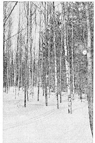
Raunion mäen nykyistä metsää ensimmäisen harvennuksen jälkeen.

Siten muodostaa yhtiön metsätalous yhden hampaan koko maamme metsätalouden suuressa rataspyörässä ja koettaen metsänhoitoa sekä sen käyttöä kehittämällä vastata paikastaan siinä.