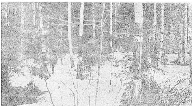
Kaunis koivikko Kartanon haasta. Tuohiminen tehnyt aiotusta faneerikoivusta — halkometsää.

— Klubin elokuvat, viimeinen tänä keväänä, näytetään lauantaina ja sunnuntaina klo 19. Sallittu lapsille.