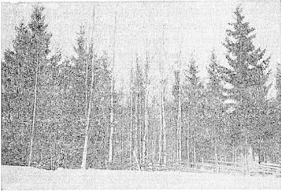
Raunion mäen nykyistä metsää ennen harvennusta.