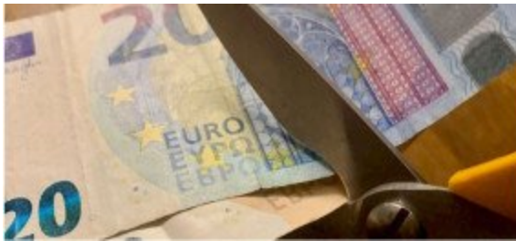
tekoälyllä tehty kuva

Talouspolitiikan arviointineuvoston helmikuun alussa julkaisema raportti ja sen ehdotukset eläkkeiden leikkaamisesta ovat herättäneet kovasti keskustelua. Äänensä tuntuvat pääosin saaneen läpi ne, jotka kannattavat leikkauksia tai muuten allekirjoittavat neuvoston esitykset. Eläkeläisliittojen etujärjestö EETU ry:n kriittinen kanta asiaan liittyen ei juurikaan mennyt läpi mediassa.