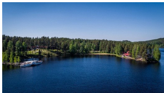
Keurusselkä Resort.

Elinvoimaa vapaaehtoiselle koulutus saapuu syksyllä Keuruulle, joka sijaitsee kätevästi useamman piirimme risteyskohdassa. Tämä koulutus antaa perustietoa ikääntyneen mielen hyvinvoinnista ja sen vahvistamisesta sekä vapaaehtoisen oman hyvinvoinnin ja