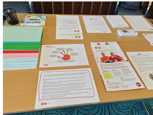
Elinvoimaa-toiminnon esittelypöytä järjestöristeilyllä

Miltä tämä uutiskirje vaikuttaa? Kaikki palaute on tervetullutta!