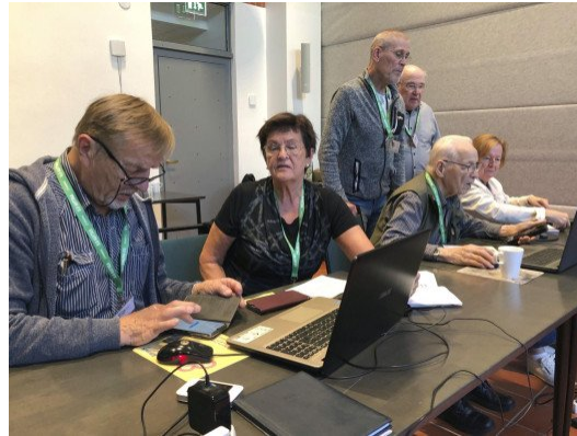
Digiopastusta Jyväskylän Palokassa.

https://www.verkostavirtaa.fi/yhteystiedot/