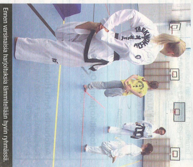
Ennen varsinaisia harjoituksia lämmitellään hyvin ryhmässä.