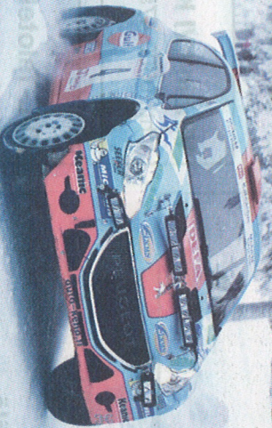
Mika Salo jantaa perjantaina ja lauantaina Mikkelissä ja sen ympäristössä ajettavan SM-rallin voittoa.