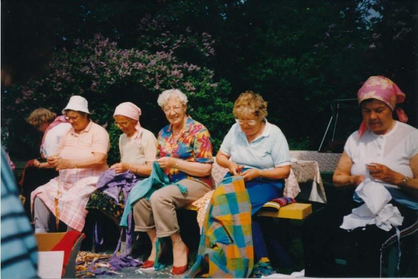
Matonkuteiden leikkaajat työssään

Toimitila harrastustoiminnan kannalta on erittäin tärkeä, pitää olla paikka minne kokoonnutaan. Ohjelmaryhmien käyttöön harjoituksia varten on saatu kaupungilta kohtuullista korvausta vastaan tiloja eri paikoista