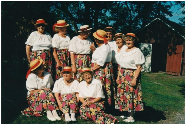
Senioritanssijat ryhmäkuvassa Lehtolassa

Rauman Eläkkeensaajilla on ollut kunnia saada järjestää Kesätapahtuma ensimmäisenä piirimme alueella. Juhlat olivat Lehtolan ja Merskan alueella kesällä 1975. Tilaisuuteen osallistui noin 750 henkilöä. Juhla on järjestetty vuosien saatossa useasti Raumalla.