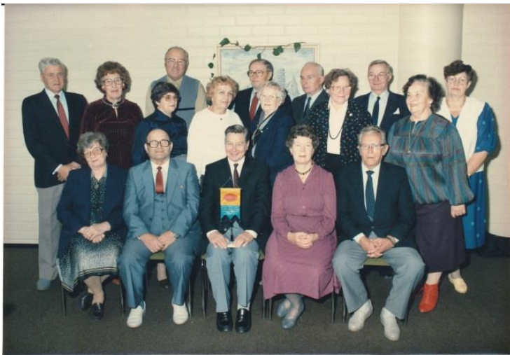
Yhdistyksen johtokunta 20-vuotisjuhlakuvassa