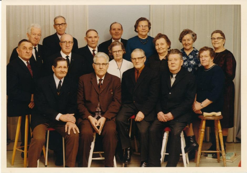
Hallituksen ryhmäkuva maaliskuu 1972