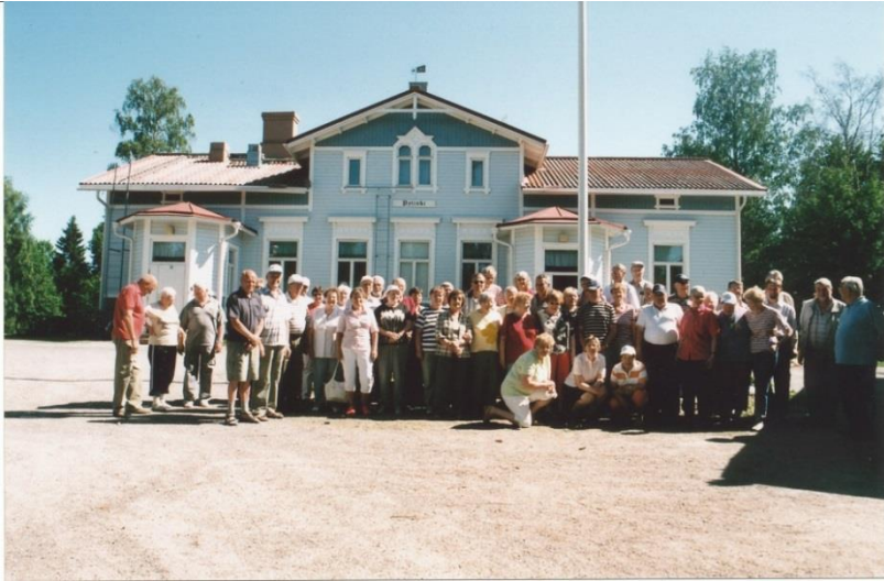
Virrat, Rajaniemen Lomakeskus 9.6.2007

Retkeilytoiminta on ollut erittäin suosittua jäsenistön keskuudessa yhdistyksen koko toiminnan ajan. Matkoja on tehty linja-autolla laivalla ja hieman lentokoneellakin. Matkoista on muodostunut tuhansia kilometrejä ja näin yhdistyksen retkeilytoiminta on työllistänyt liikenne- matkailu- ja ravintola-alan henkilöstöä sadoilla työpäivillä.