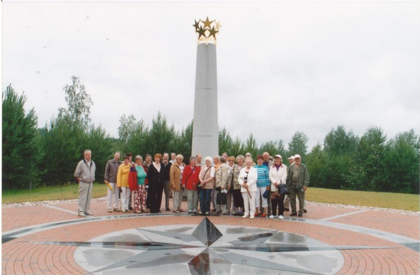
Liettua, Euroopan keskipiste 17.6.2008

2000-luvun alkuvuosina tehtiin Viroon viikon kylpylämatkoja sekä kiertomatkoja eripuolille Viroa. Matkakohteita olivat myös Latvian Riika ja Liettuan Vilna. Laivaristeilyt lähinnä Ruotsiin ja Tallinnaan ovat suosittuja