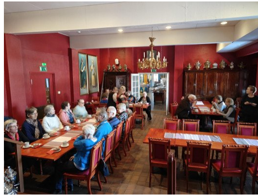
Munkkikahvit Punaisessa salissa

Paas poiketen -koulutuksessa tutustutaan toimintamalliin ja sen periaatteisiin, harjoitellaan kohtaamista ja suunnitellaan oman toiminnan käynnistämistä, koordinoimista ja markkinointia.