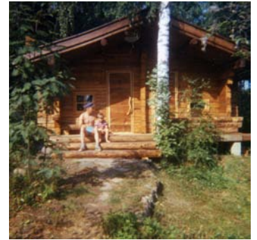
Juuri valmistuneen savusaunan rappusilla istuskelen poikani Kimin kanssa kesällä 1969.

Onko Sinulla ollut unohtumaton sauna- tai uintireissu? Kerro kokemuksestasi!