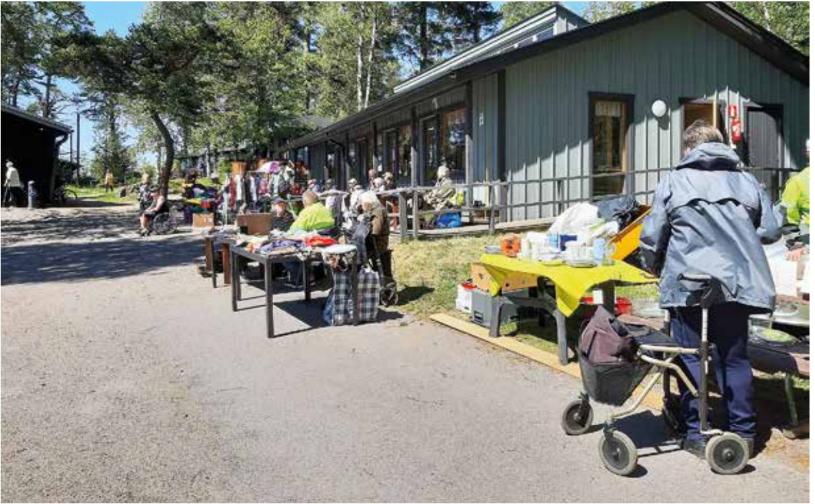
Lomakylän kirppistapahtuma 2019 kesällä.

VANTAAN Invalidit järjestävät naistenpäivän la 25.4. klo 12–16 Markkulassa (Vanha Kuninkaantie 5, 01300 Vantaa). Myös HIY:n jäsenet ovat tervetulleita. Lisätiedot Vantaan Invalidien toimistolta: 040 576 3880 / toimisto@vantaainvalidit.fi.