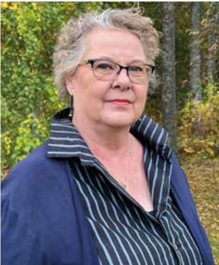
PUHEENJOHTAJAN kuulumiset s. 5