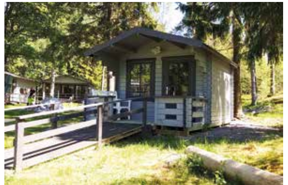
Mökki nro 3