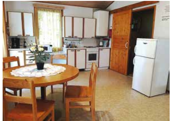
Iso mökki sisältä