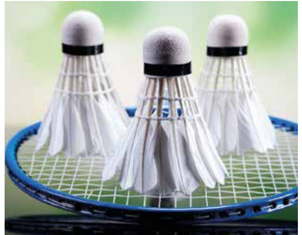
KEVÄTKAUDEN kerhot ja liikuntaryhmät s. 19

TÄYTTÄ ELÄMÄÄ ON HELSINGIN INVALIDIEN YHDISTYS RY:N JÄSENLEHTI. LEHTI ILMESTYY NELJÄ KERTAA VUODESSA.