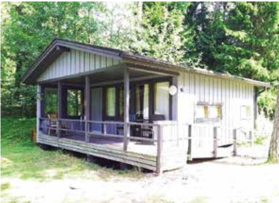
Iso mökki (16 / 17)