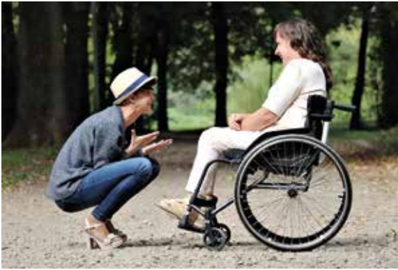
AVUSTAJAVÄLITYKSEN asiakkaaksi s. 14