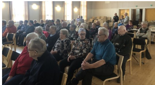
Tuvan täydeltä väkeä Kemissä

Matka oli pitkä, mutta kannatti käydä! Elinvoimaa tarjosi koulutuspäivän kaikille Lapin piirin eläkkeensaajille yhteistyössä Veitsiluodon Eläkkeensaajien kanssa. Mukavassa päivässä oli asiaa mielen hyvinvoinnista ja hyvästä vuorovaikutuksesta yhdistystoiminnassa. Asian lomassa laulettiin ja tanssittiin sekä nautittiin emäntien herkullisista tarjottavista. Kiitos kaikille eri yhdistyksistä mukana olleille.