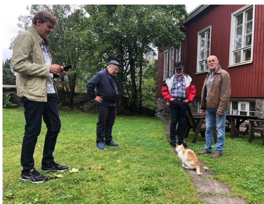
Opastajien koulutus- ja virkistyspäivillä opastajat lumoutuivat Käpylän työväentalon talonmiehen yli 20-vuotiaasta Misu-kissasta.