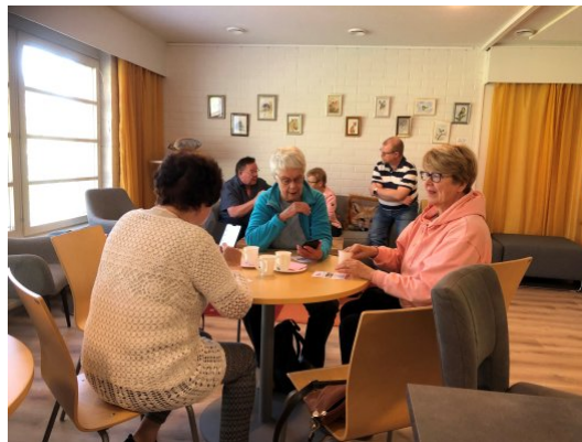
Vertaisopastausta Lemmin Elämyspäivässä syyskuussa 2023.

Haluamme kertoa mahdollisimman laajasti teidän vapaaehtoisten tekemistä vertaisopastuksista ja sen vuoksi julkaisemme opastuspaikkatietonne myös Verkosta virtaa -nettisivuilla. Ja saattaaahan joku nettisivujen kauttakkin löytää opastuksiinne. Välitämme opastuspaikkatiedot halutessanne myös SeniorSurf-opastuspaikkatietoihin.