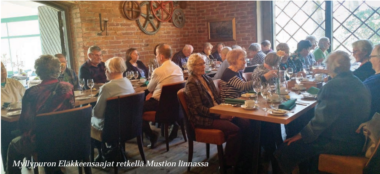
Myllypuron Eläkkeensaajat retkellä Mustion linnassa