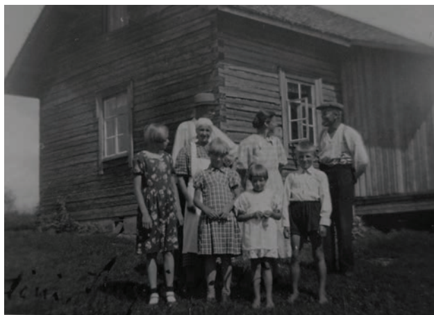
Kuva: Meidän koti välirauhan aikaan ja perheemme ja vieraita. Minä pienimmäisenä keskellä.

äitinsä, minun mummini kuolemasta. Siitä ilmoitettiin radiossa, koska omaisten osoittehan eivät olleet tiedossa. Mummi oli vasta 65-vuotias, mutta jo toinen evakkotai- val varmaankin uuvutti hänet.