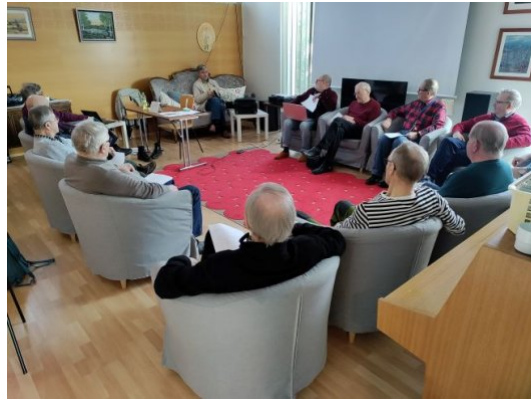
Nestorit tutustumassa Onnelassa 11.3.

Oma Nestorit-ryhmänne, kerhonne, yhdistyksenne tai useampi yhdistys yhdessä voitte hakea järjestäjiksi valtakunnalliseen Nestorit-tapahtumaan viikolla 45 yhteistyössä Elinvoimaa-toiminnan kanssa. Juhlasta saa suunnitella ihan oman näköisen.