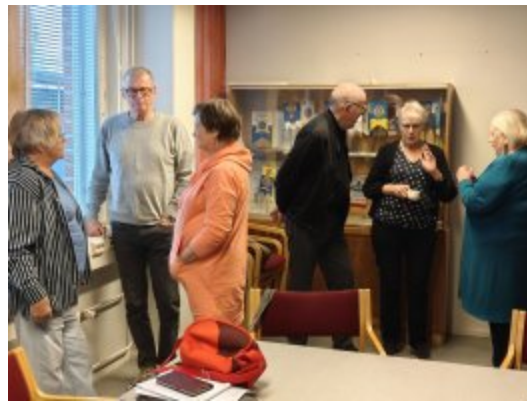
Paas poiketen koulutuksessa Kankaanpäässä 28.-29.10.

Ilmoittaudu viim. 25.11. TÄSTÄ Saat teams-linkin sähköpostiisi tapahtumaa edeltävänä päivänä.