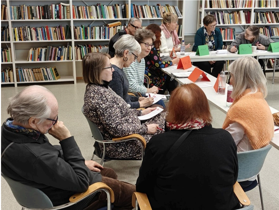
Elinvoimaa vapaaehtoiselle -koulutus 6.-7.11. Kulttuurikeskus Sofiassa Helsingissä

11.11. Mouhijärven Eläkkeensaajien kanssa järjestimme Paas poiketen -tilaisuuden, jonne kutsuttiin yhteistyökumppaneita ja muita toiminnasta kiinnostuneita sekä Paas poiketen -vierailijoita ja heidän isäntiään ja emäntiään. Myös Mouhijärvellä toimittaja on ajan hermolla ja teki jutun Tyrvään Sanomiin.