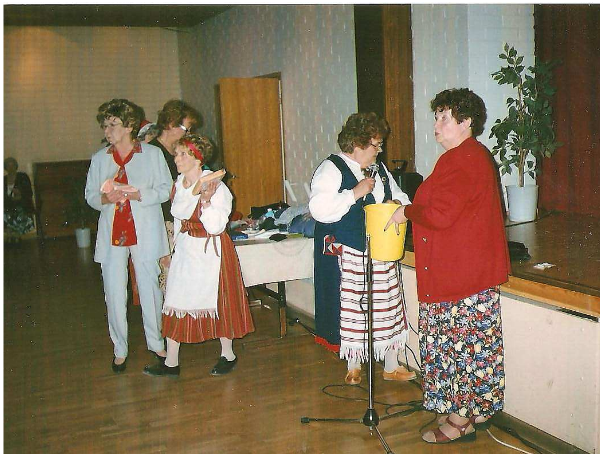
Arpajaisilla saadaan tuloja.