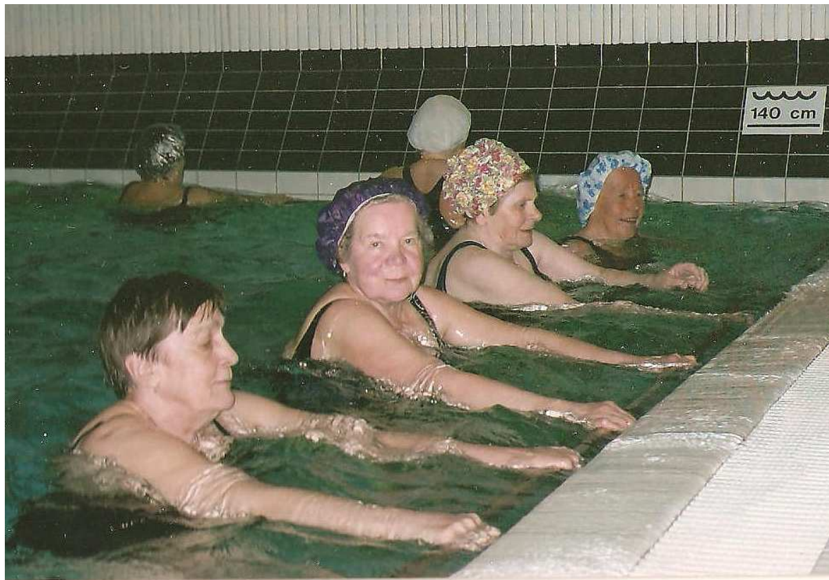
Vesivoimistelun riemua uimahallin altaalla