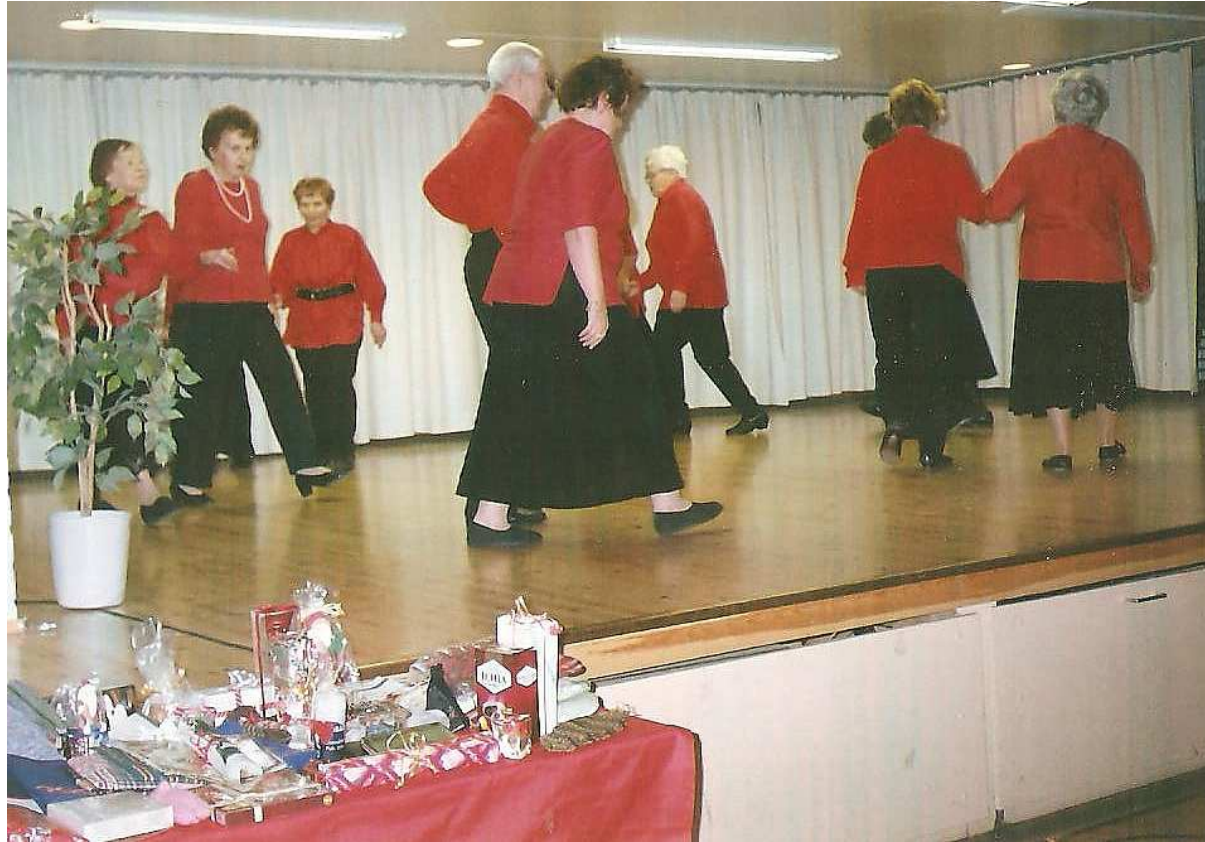
Senioritanssi kuuluu juhlien ohjelmaan.