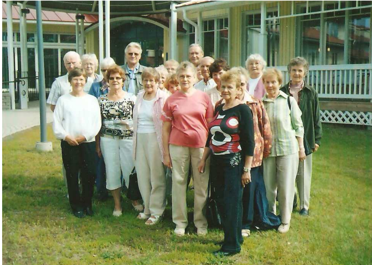
Kaustisen terveyskylässä kuntoa kohottamassa 2007.