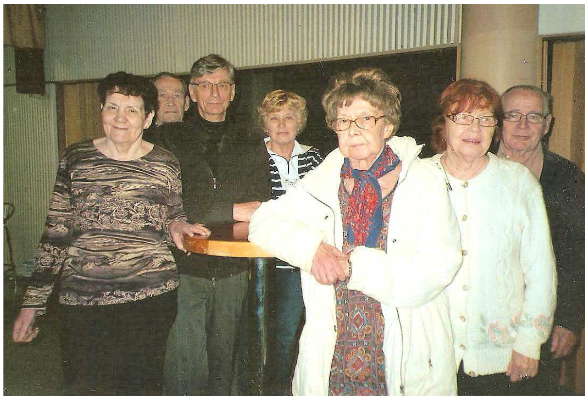
Johtokunnan varsinaiset jäsenet syksyllä 2012.