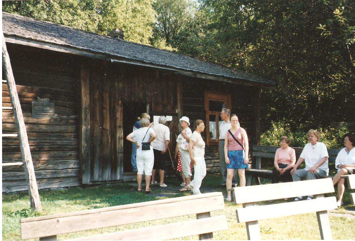
Kesäretkellä 2004 poikettiin Pielavedelle Urho Kekkosen syntymäkotiin Lepikon torppaan.