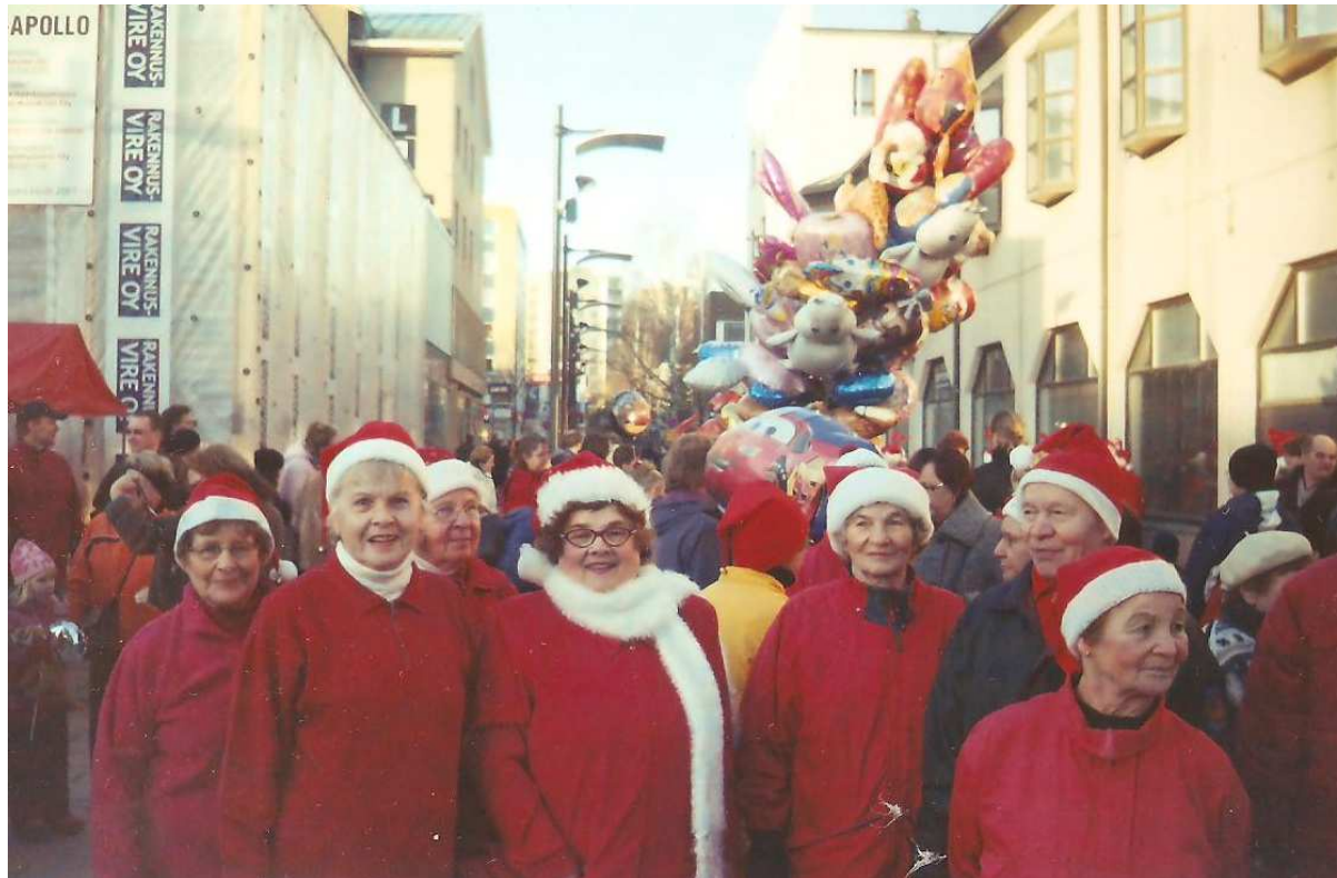
Tanhuryhmäläisiä Granitinaukiolla Joulunavauksessa 2.12.2006.