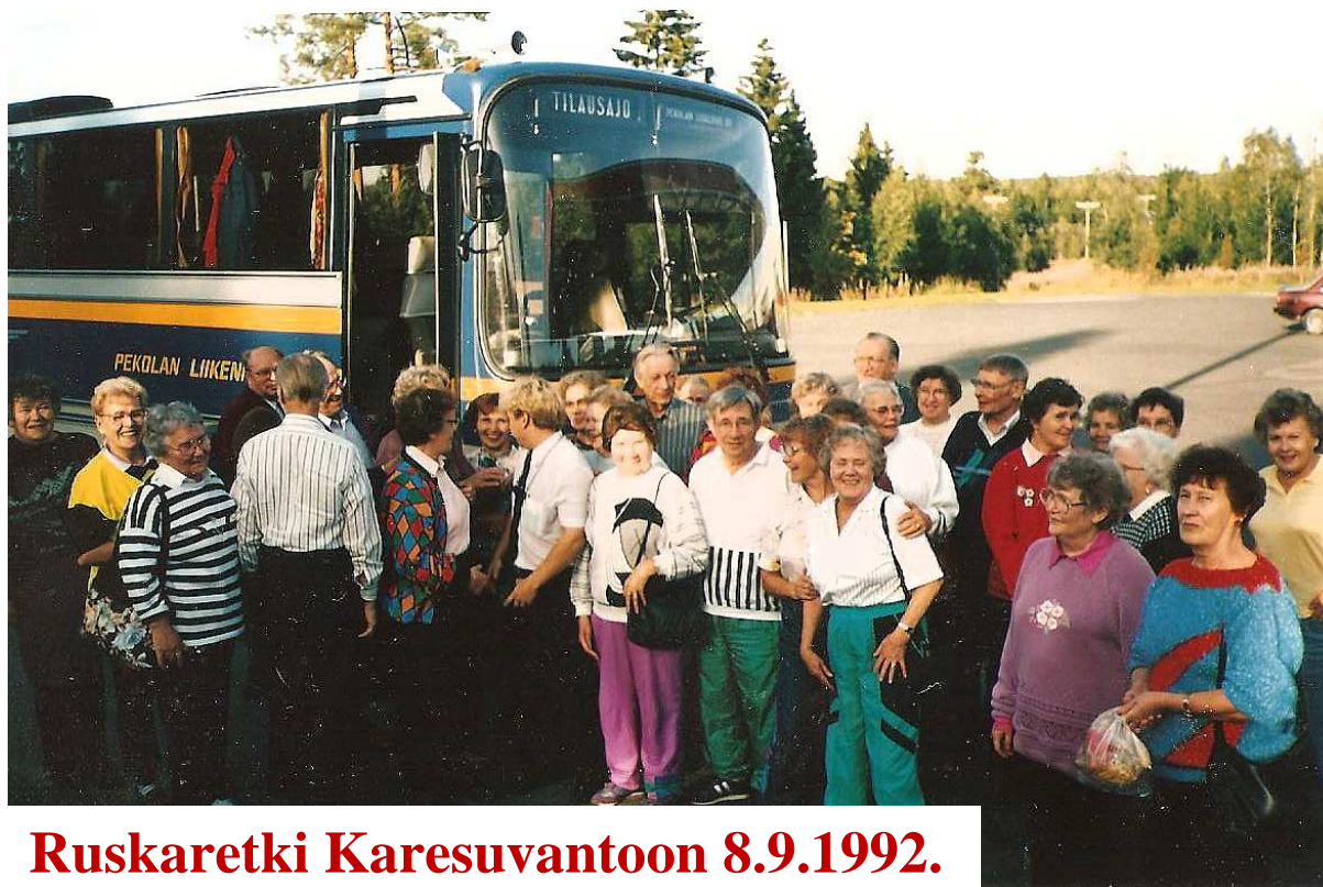
Ruskaretki Karesuvantoon 8.9.1992.