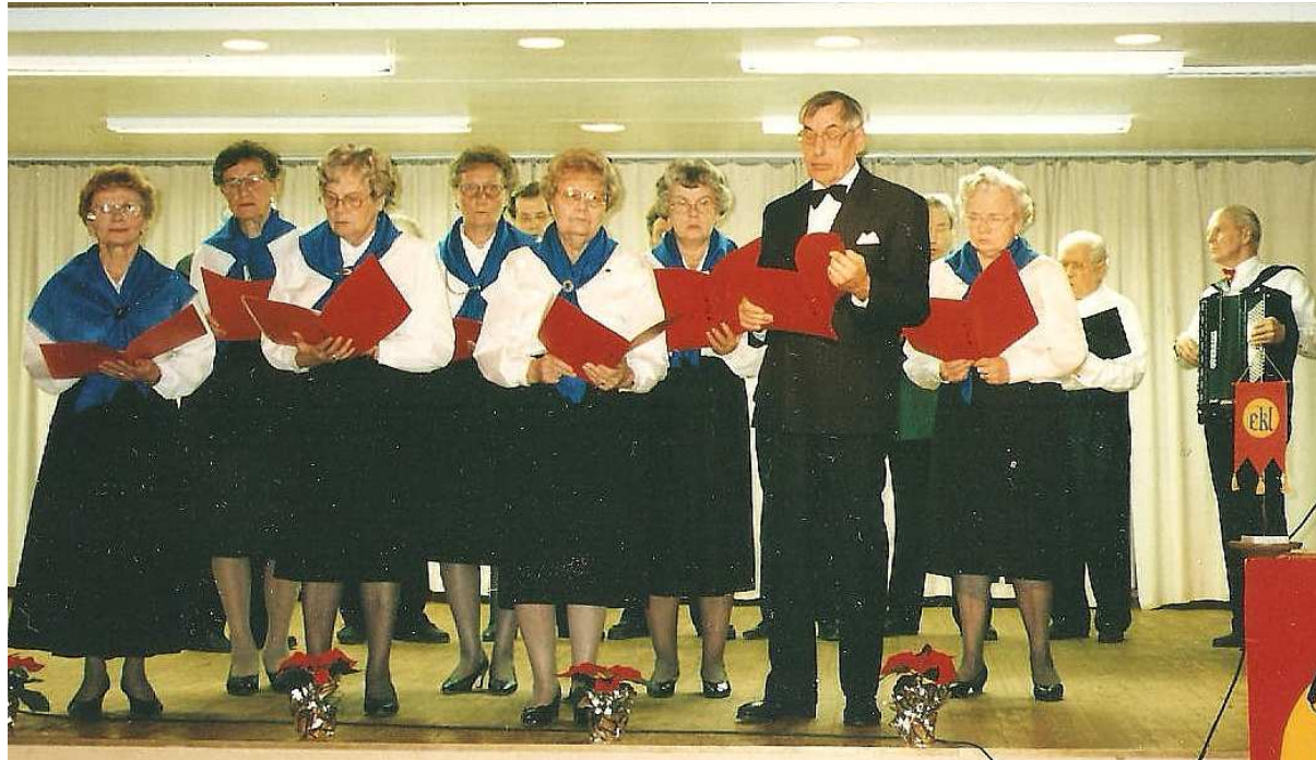
Lausuntakerho esitti 35-vuotisjuhlassa Hymnin Hämeelle.