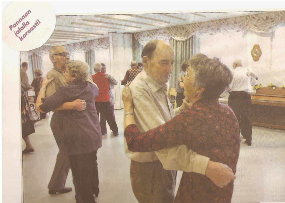
Inkilänhovissa sokeainviikon tansseissa 2008.