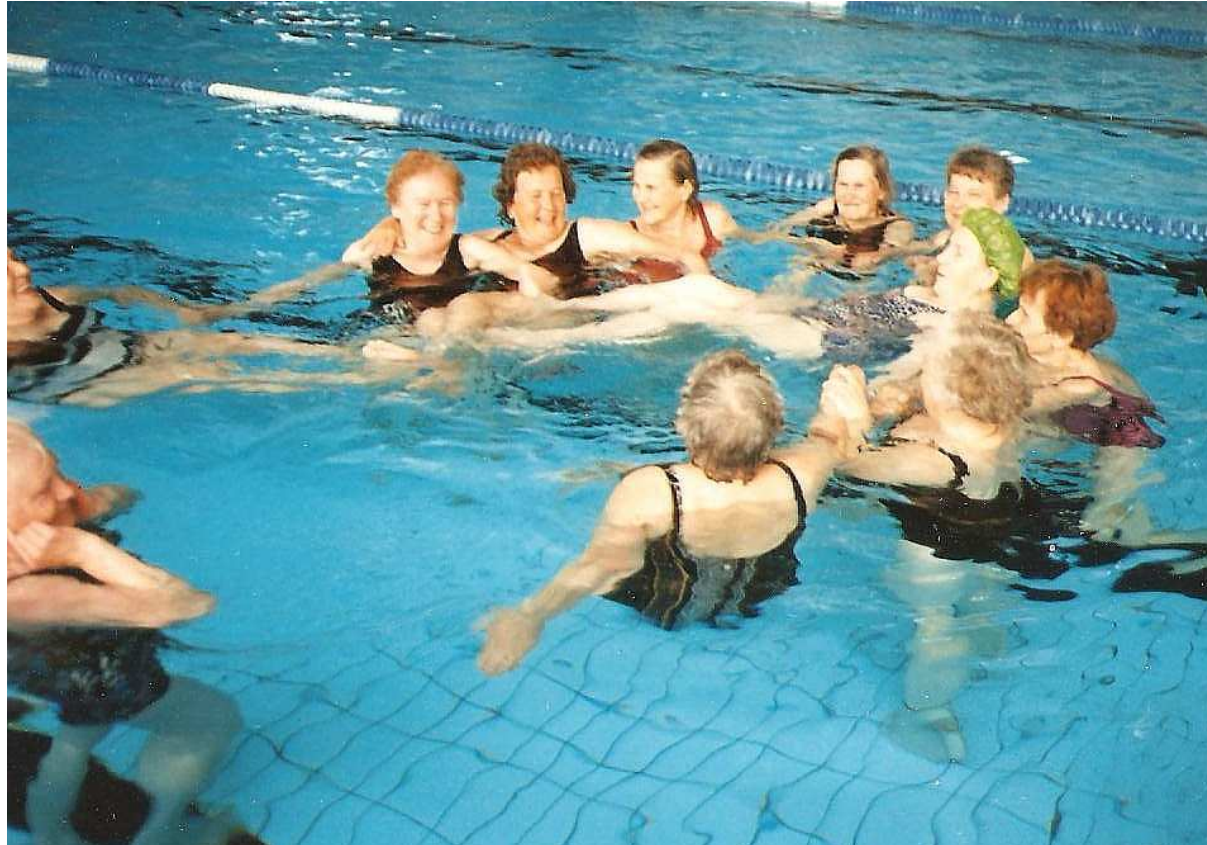
Kunnon kohotusta hauskalla tavalla.