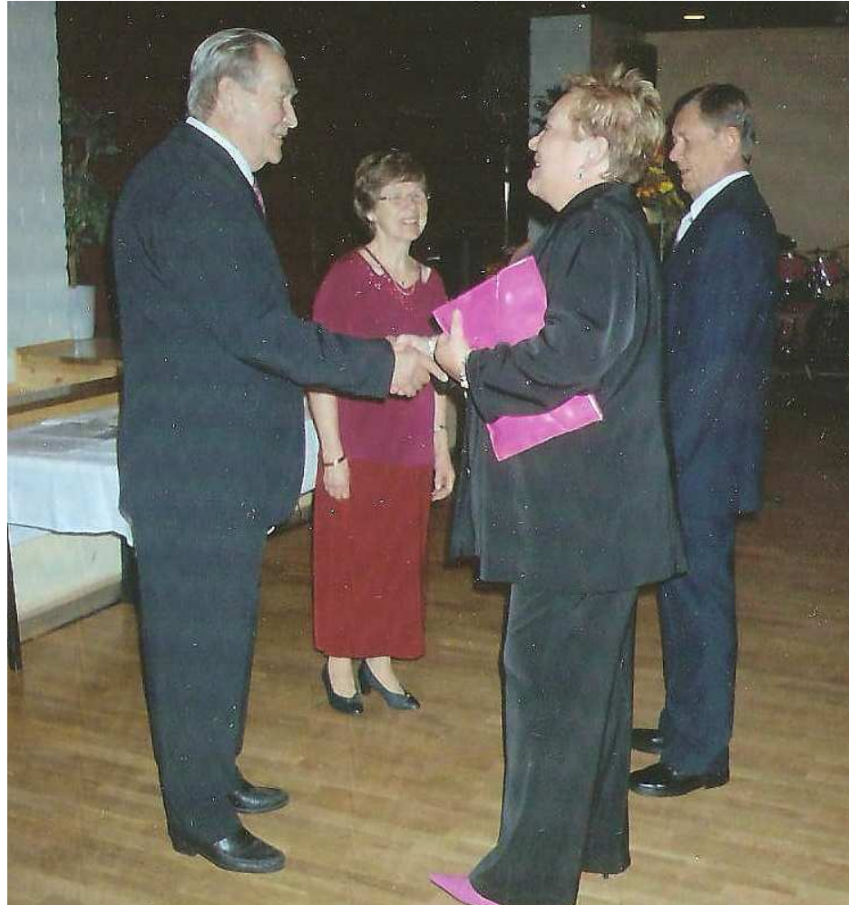
Onnitteluvuorossa Riihimäen Kansalliset seniorit.