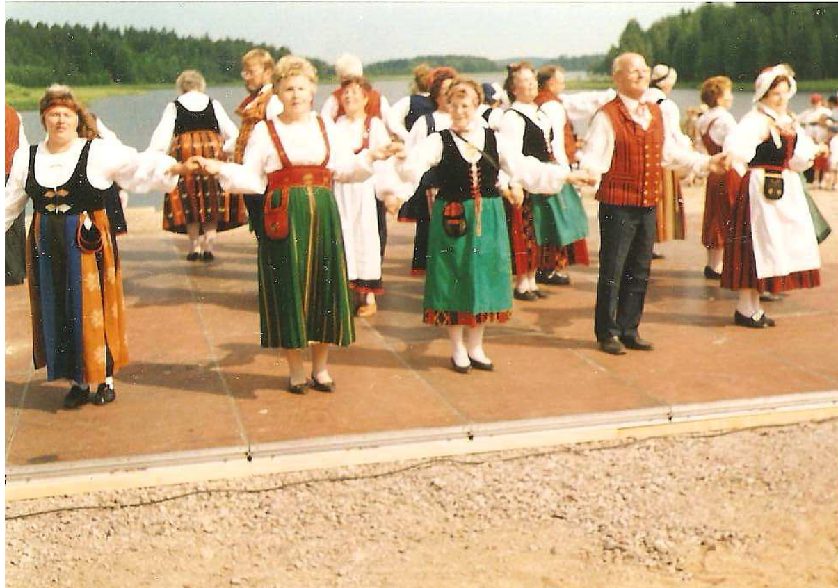
Tanhukerholaiset Mommilan soututapahtumassa 16.7.1994.