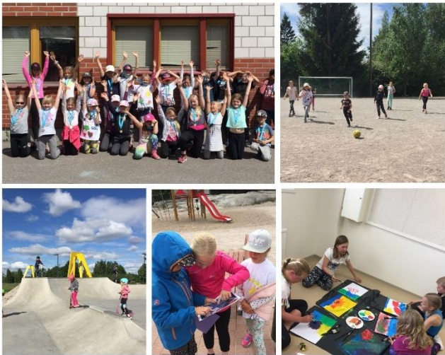
JÄRVENPÄÄN VOIMISTELIJAT RY

Järjestämme tänäkin kesänä kesäloman kahdella ensimmäisellä viikolla (3.6. – 7.6. sekä 10.6.-14.6.) Sporttileirit 1.-4. luokkalaisille lapsille. Leiri 2:lla on vielä kaksi vapaata paikkaa. Käy pian ilmoittautumassa mukaan!