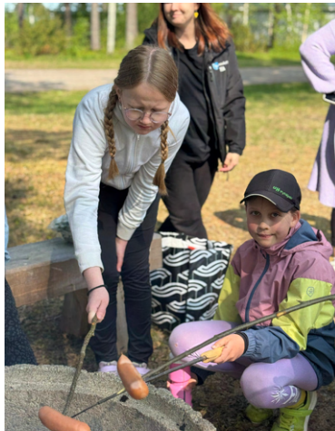
Retkellä on aina mukavaa!