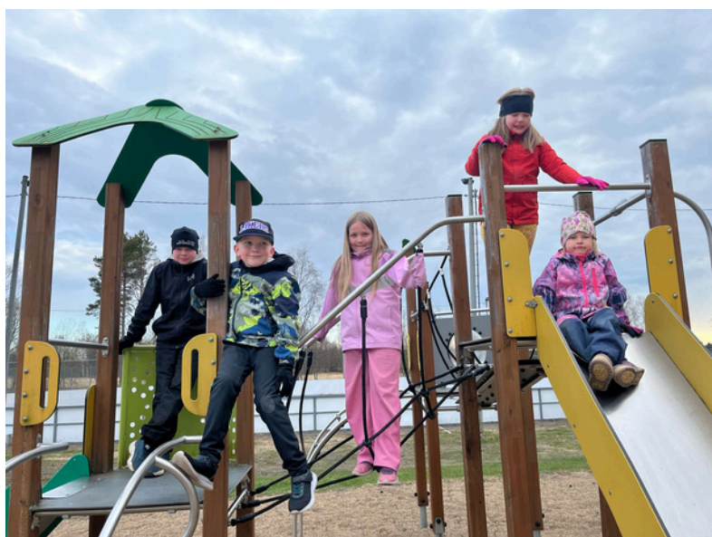
Pirttikosken puuhakerhon touhuja