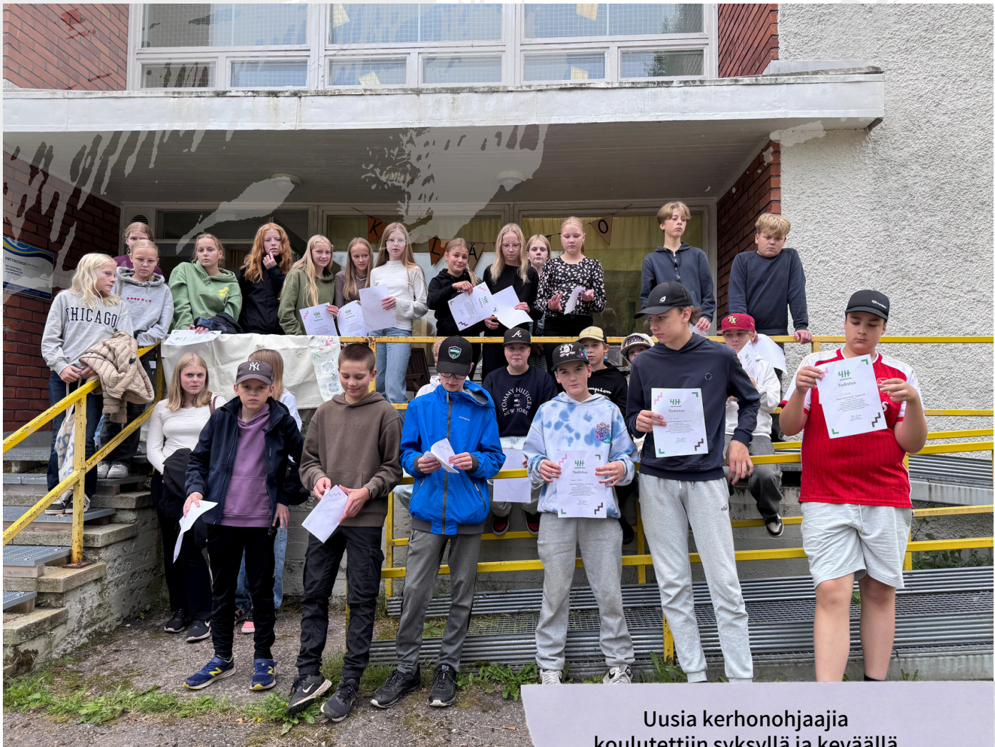
Uusia kerhonohjaajia koulutettiin syksyllä ja keväällä