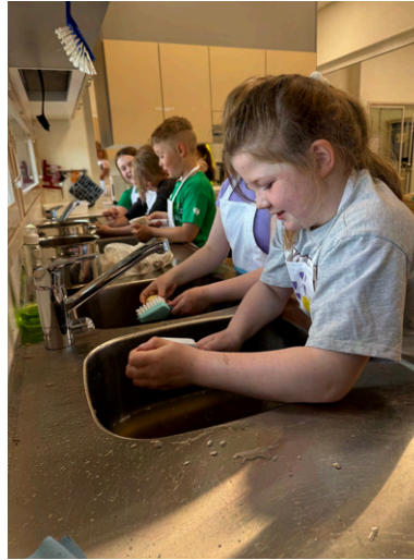
Ruokakoulussa oli innokkaita perunanpesijöitä. Tuunattiin myös ikiomat essut!