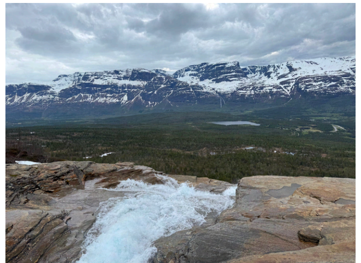
Hengenin putous ylhäältä katsottuna