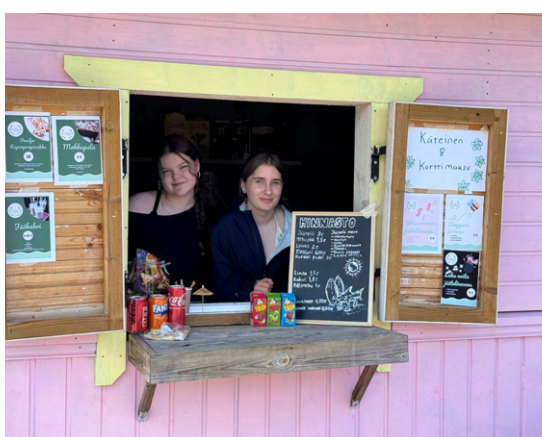
Kesäkioski on suosittu paikka yrittää