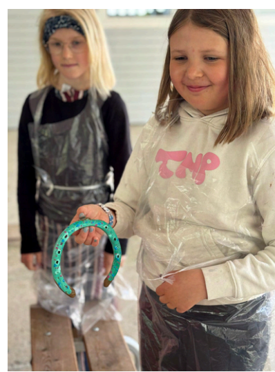
Eläinleirillä tuunattiin hevosenkenkiä