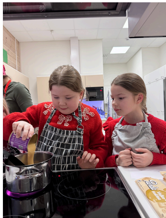
Joulun alla Joulukarkkipajassa kokkailtiin herkkuja