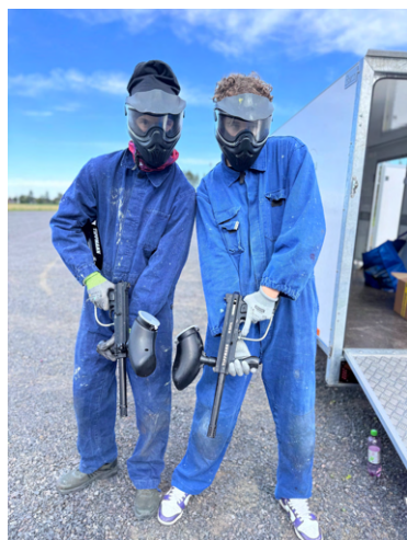
Nuorten liikuntakerhossa paintballia