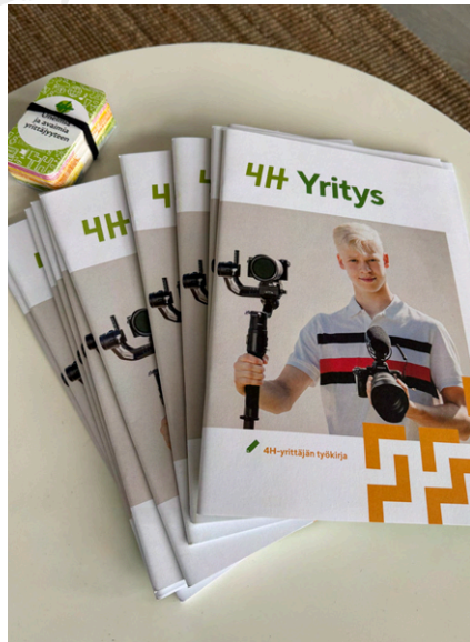
Nuoret laativat liiketoimintasuunnitelman