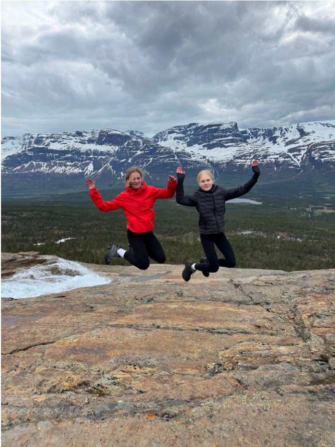
Norjan vaeltajat huipulla