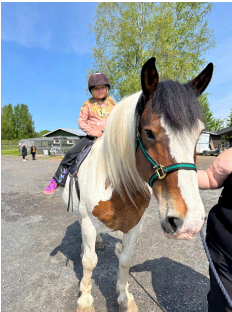
Eläinleirillä vietettiin yksi päivä Hulivilissa, josta löytyi monenlaista ystävää koiranpennuista hevosiin.