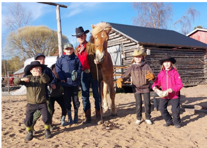
Heppakerhossa taidot siirtyvät sukupolvelta toiselle