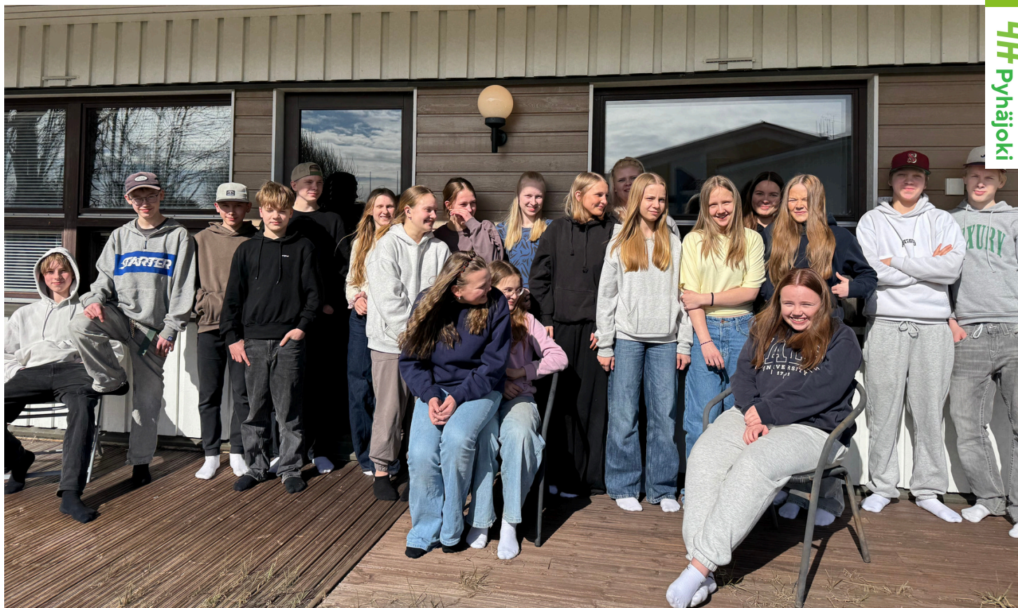
Kerhoja ohjasivat kerhonojajakoulutuksen käyneet nuoret. Kuvassa nuoret kevään kerhokauden päättäjäisissä.