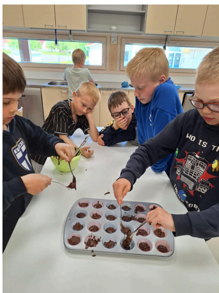
Ruokakoulussa valmistu jälkkärit myös.