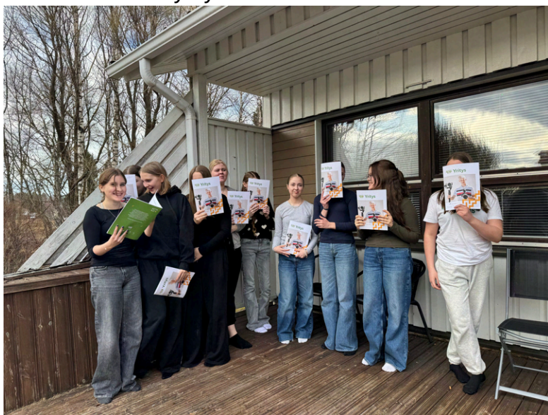
Uusia 4H-Yrittäjiä valmistui keväällä ja syksyllä