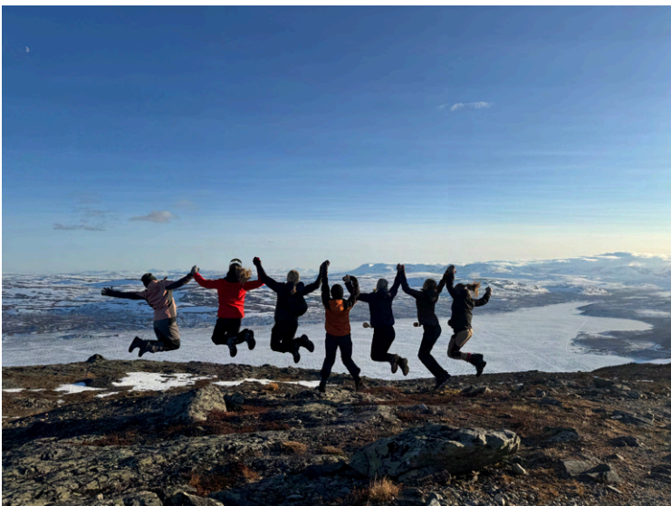
Näkymää Saanalta väritti joukko nuoria