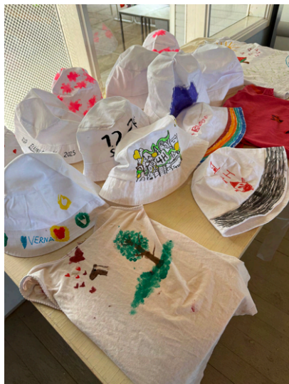
Leirihatut kuuluu joka leiriin!