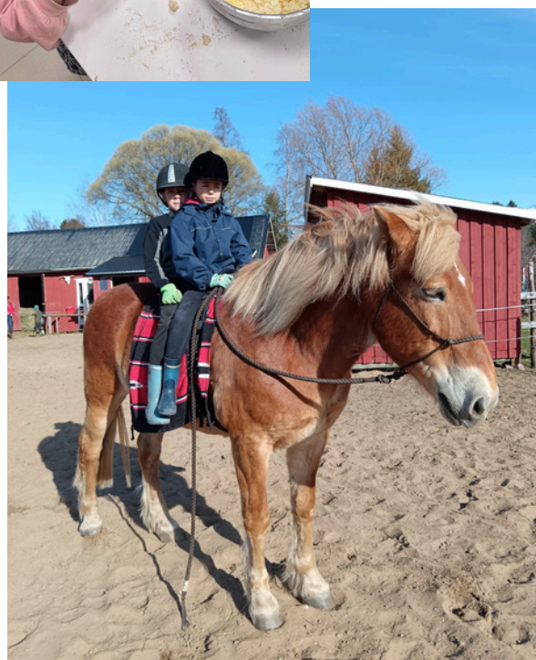
Heppakerhossa pääsi ratsastamaan