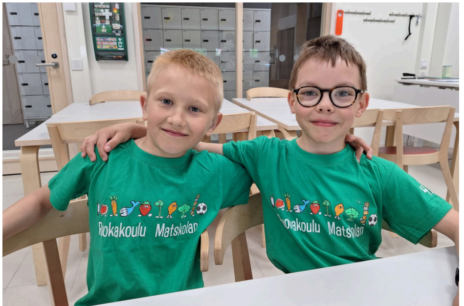
Ruokakoulussa on reippaita kokkailijoita!