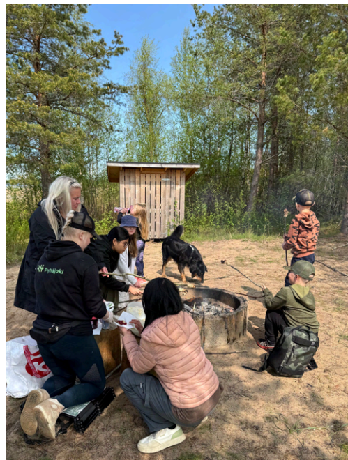
...Ja tikkupullat myös!