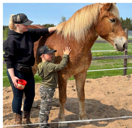
Inka Vierimaan Onnenkenkä yrityksessä riitti asiakkaita