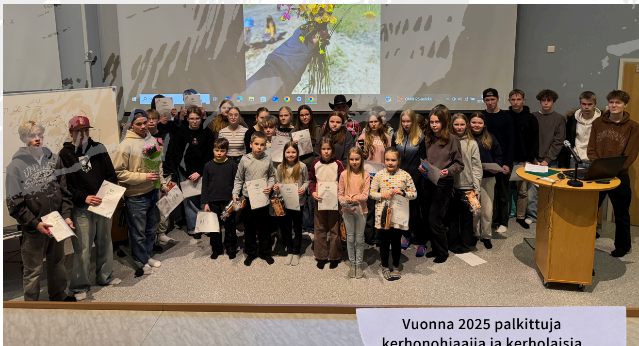
Vuonna 2025 palkittuja kerhonohjaajia ja kerholaisia

4H-yhdistyksen sääntömääräisessä kokouksessa 27.3.2025 palkittiin vuonna 2024 ansioituneita 4H-nuoria.