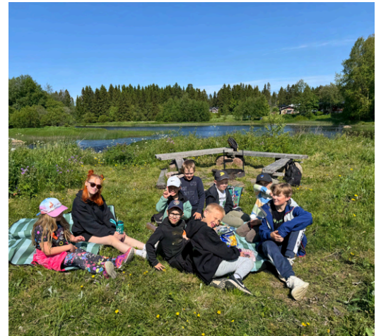
Kielosaari on myös mieluisen retkipaikka liikuntaleiriläisille