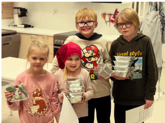
Kokkikerhossa karjalanpiirakoiden leipomista

Kerhotoimintaa järjestettiin keskustassa, Yppärissä, Pirttikoskella ja Parhalahdella. Kerhokalenterissa toistuivat tutut teemat: Ruuanlaitto ja leivonta, liikunta, kädentaidot, luonto ja retkeily sekä eläimet. Kerhotoimintaan saimme avustusta Pohjois-Suomen Aluehallintovirastolta.