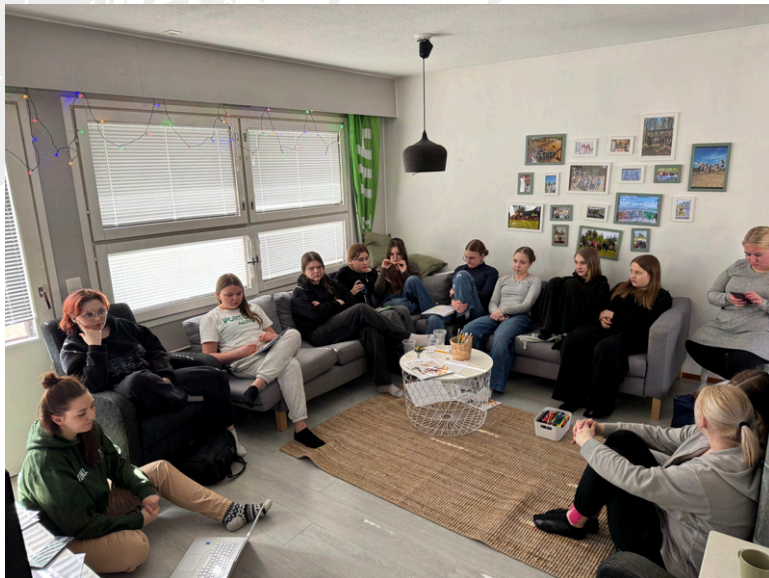
Kevään yrityskoulutuksessa kävi kuhina!

4H-yrityksiä oli 49 (41kpl/2024) ja niiden yhteenlaskettu myyntitulo oli 47 419,66e ( 33 402,35€ /2024). Vuonna 2025 Pyhäjoelle perustettiin 25 uutta 4H-Yritystä.