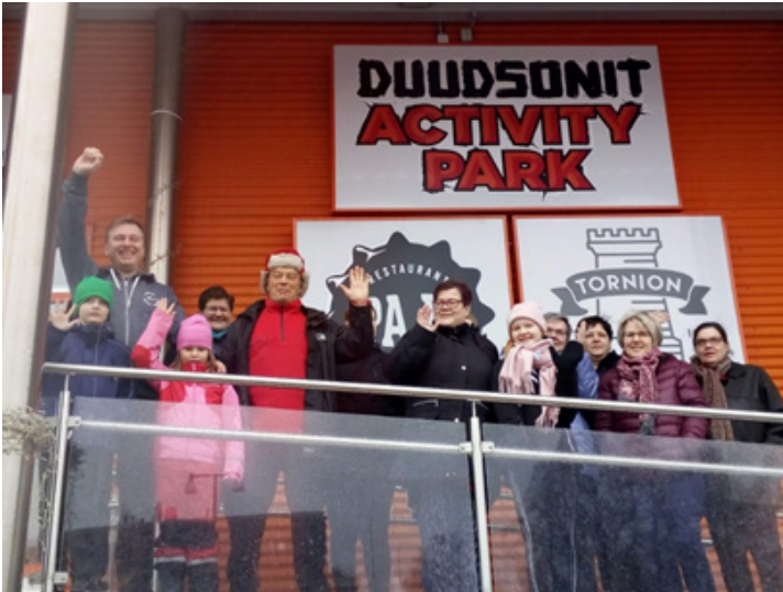
Jytyläiset Tornio-Haaparanta perheretkellä

Vaikka itse bussimatkakakin oli jo elämys perheen pienemmille, oli retken ehdoton kohokohta päästä testaamaan Duudsonparkin aktiviteetteja ja laitteita. Nauru raikui ja liikettä riitti. Retken aikana oli mahdollista käydä shoppailemassa Haaparannan Ikeassa sekä muissa liikkeissä. Tulomatka taittui joutuisasti Jyty-visan parissa. Tärkeää oli yhdessä tekeminen ja hyvät palkinnot. Reissu oli mukava ja kannusti suunnittelemaan uusia tempauksia tulevaisuudessaakin. Suosittelemme yhteisiä perheretkiä muillekin.