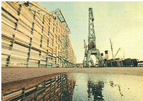
Cursor Oy / Krista Ylinen