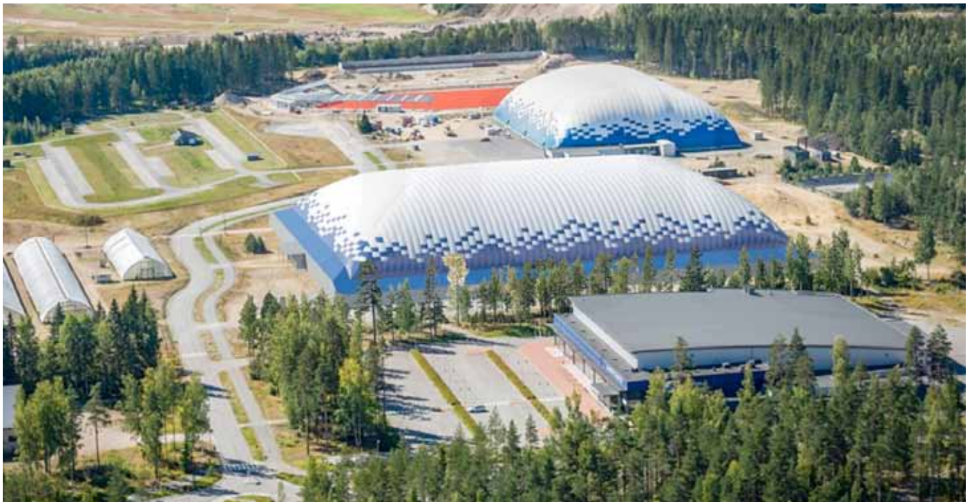
Ukonniemen uusi Talviurheiluhalli sijoittuu kiekkohallin ja Aviasport Areenan väliin. Taustalla pesäpallo- ja hiihtostadion. Asiaa koskeva kaavamuuotos hyväksyttiin Imatran kaupunginvaltuustossa loppukesällä 2016.

”Valtuusto antoi asiaan vahvan kannan: hanke toteutetaan, kunhan se on järkevä ja hankkeen puuhaajilla pysyvät niin sanotusti ’terät jään pinnalla’. Tähän pyritään ja asian tiimoilta kokoon-tuva projektiryhmä onkin jo tehnyt ensimmäisiä avauksia niin koti- kuin ulkomaisten sijoittajien suuntaan.”