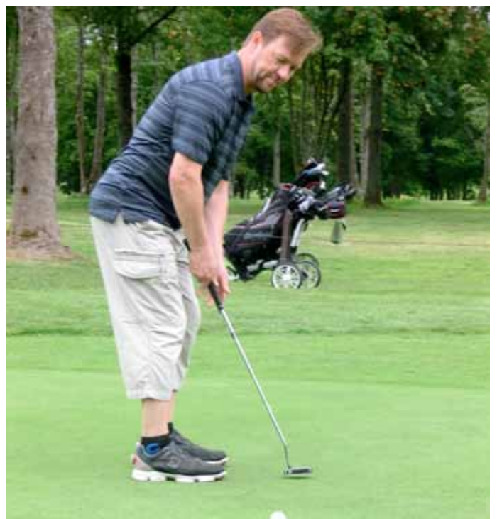
Jounin onnistunut puttaus