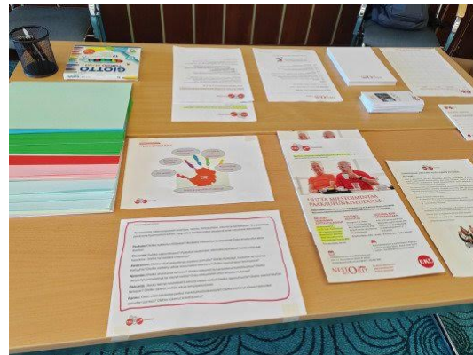
Elinvoimaa-toiminnon esittelypöytä järjestöristeilyllä

Iloista kevättä! Tässä on toinen Eläkkeensaajien Keskuliiton järjestökirje. Tämä viesti lähetetään kaikille järjestöllisten uutiskirjeiden saajille, eli saat tämän, jos olet tilannut Verkosta virtaa - digivertaisopastustoiminnan uutiskirjettä, mielen hyvinvointia vahvistavan Elinvoimaa-toiminnon uutiskirjettä, Nestorit-miestoiminnan viestejä tai koulutuksen uutiskirjeitä. Lisäksi tämä lähetetään yhdistysten puheenjohtajille ja viestintävastaaville. Kokeilemme näitä yhteisiä uutiskirjeitä tänä vuonna kolme kertaa. Muina kuukausina lähetellään eri toimintojen omia viestejä. Vuoden päätteeksi arvioimme palautteen perusteella, jatkammeko ja kehitämmekö yhteisviestejä vai palaammeko takaisin eri uutiskirjeiden lähettelyihin.