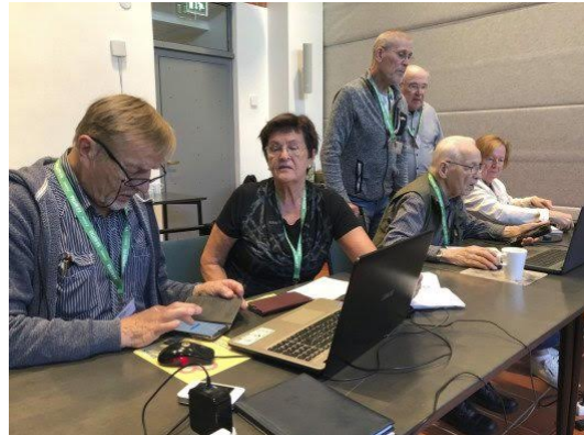
Digiopastusta Jyväskylän Palokassa.

Järjestösuunnittelijat vierailevat Eläkkeensaajien paikallisyhdistyksissä kertomassa mistä Verkosta virtaa -toiminnassa on kyse sekä houkuttelemassa uusia opastajia mukaan. Jos opastustoiminnan käynnistäminen omalla paikkakunnalla kiinnostaa, ota yhteyttä! Järjestösuunnittelijat pyrkivät vaikkapa vierailemaan kerho- tai kuukausitapaamisessa. Toivottavasti tapaaminen innostaisi opastustoimintaan paikkakunnallanne!