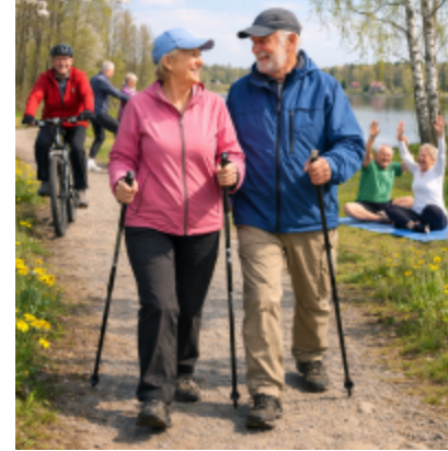
tekoälyllä tehty kuva