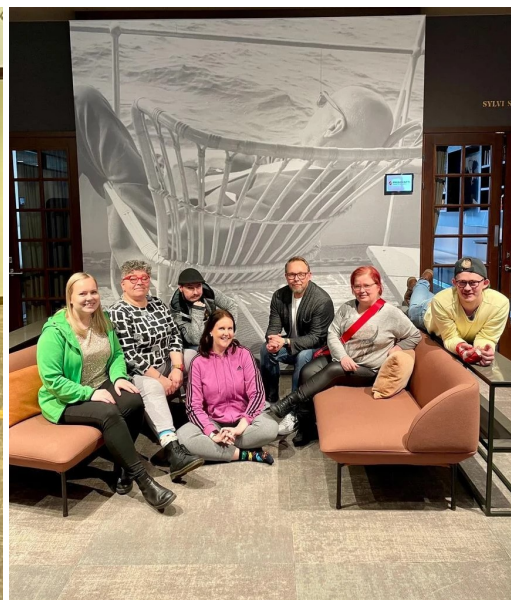
Nuoriso- ja järjestötyön ammattialaryhmä