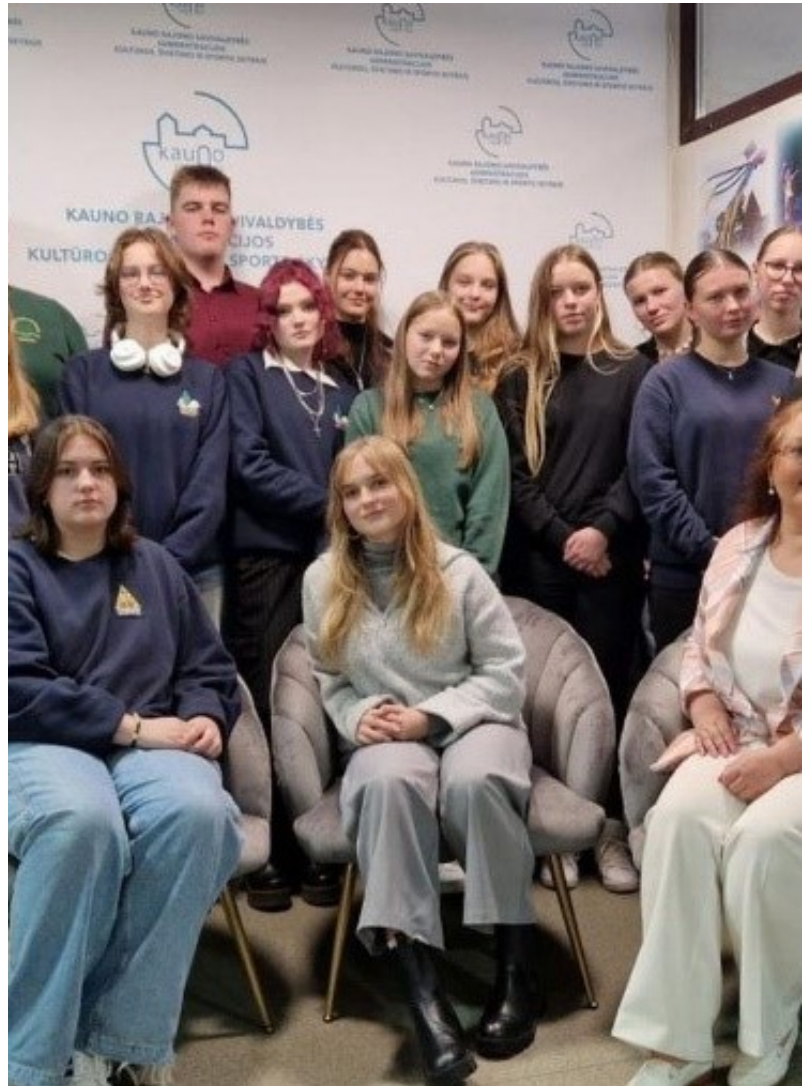
Vastavalittu Kaunasin piirin opiskelijaneuvosto (KRMT)