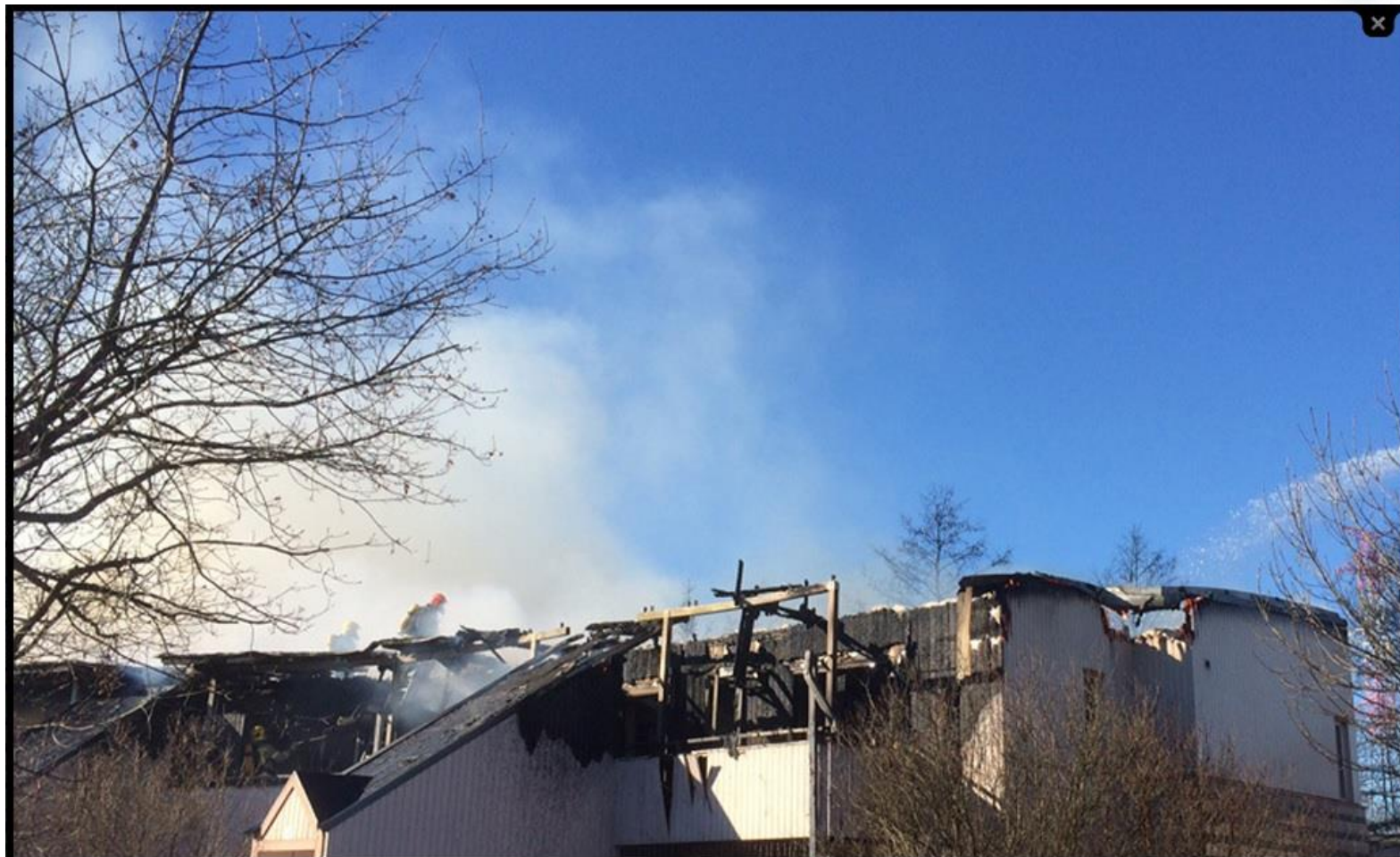
Helsingin Suutarilassa tapahtunut tulipalo ei vaatinut kuolonuhreja.

Polisi kutsuttiin teemien kotibileisiin.