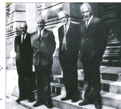
ARKISTOLAITOKSEN SUHDE TUTKIMUKSEEN JA HALLINTOON JÄRJESTYY UUELLEEN: VUODET 1944-1974