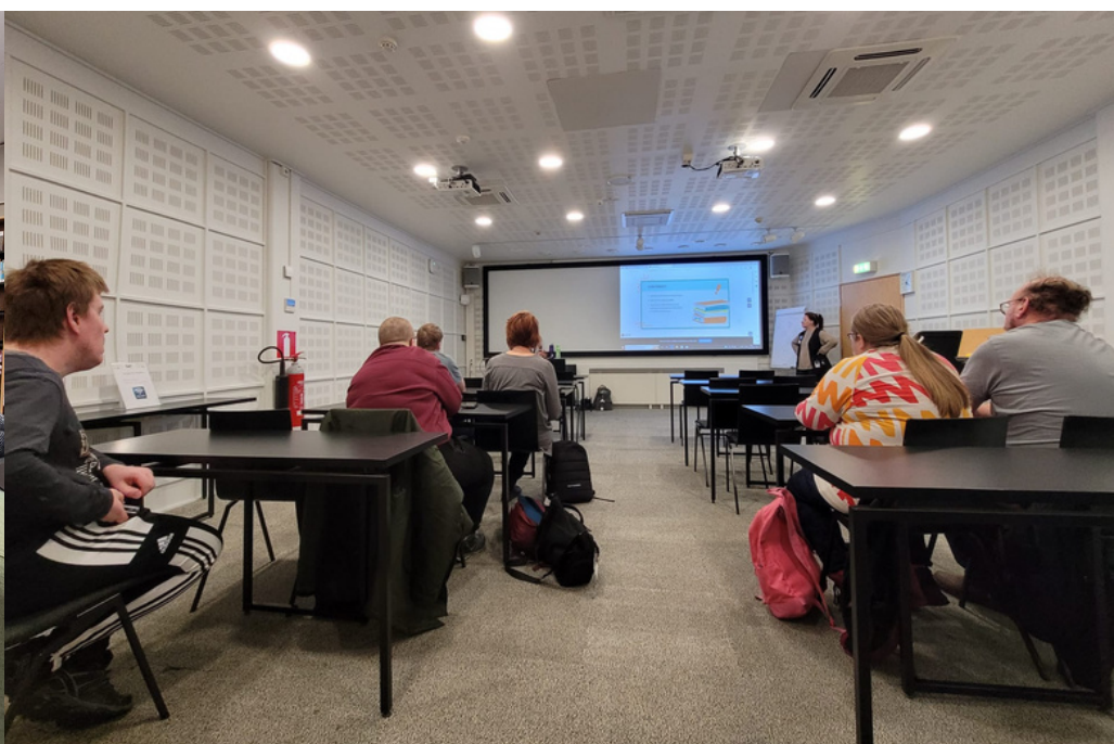
Tutustumassa kirjaston digipalveluihin