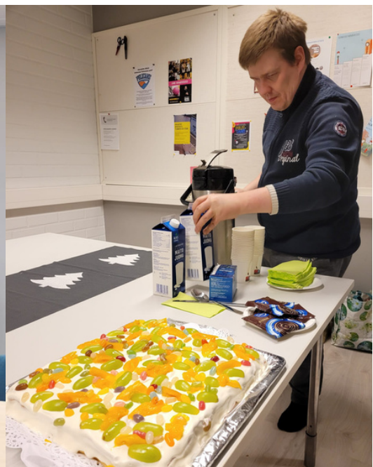
#KohtaaMut vappukahvila 2023