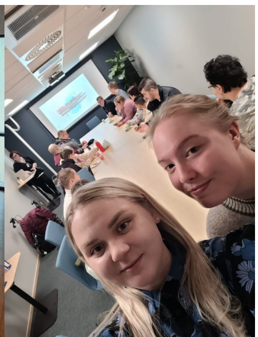
#KohtaaMut kahvila Asikkalassa