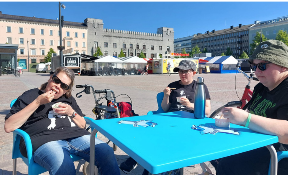
Kokkikerholaiset Aspa-säätiön tarjoamilla jäätelöillä