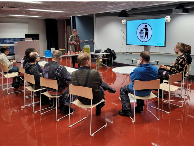
#KohtaaMut kahvilan kierrätysilta - vieraana Salpakierto