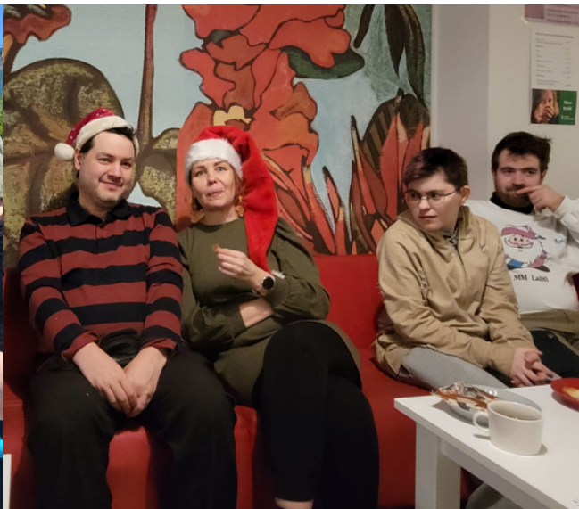
#KohtaaMut kahvilan pikkujoulut

“Hyviä muistoja jenkkiautotapahtumasta, tanssiesityksestä, jäätelöhetkestä ja piknikistä.” - Nastola poppoo