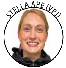
STELLA APE (VPJ)