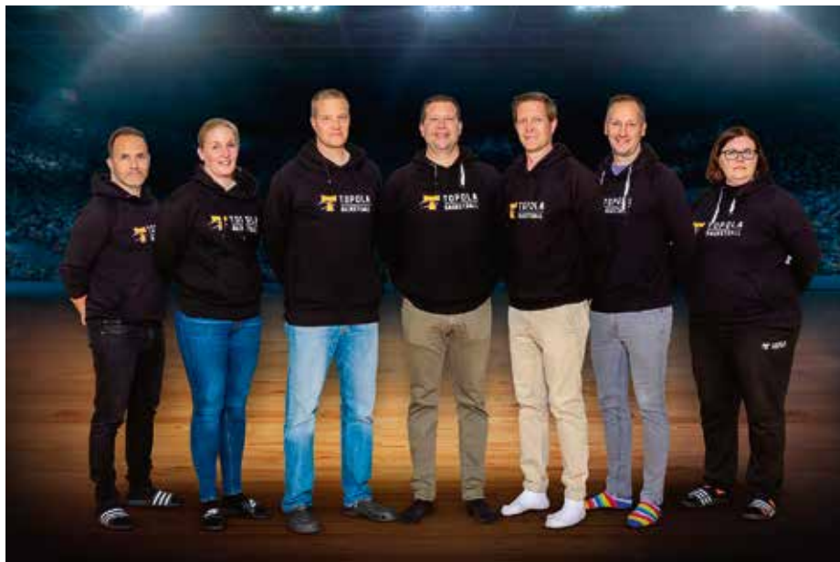
Hallitus ja toiminnanjohtaja

Valmentajiimme saat yhteyden toiminnanjohtajan tai seurakoordinaattorin kautta, heidän yhteystietonsa löytyvät myös nettisivuiltamme www.topola.fi .