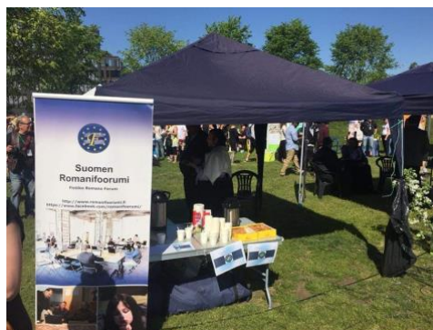
Dallapénpuistossa järjestetyt Vankimessut ; johon osallistuimme nyt kolmatta kertaa.