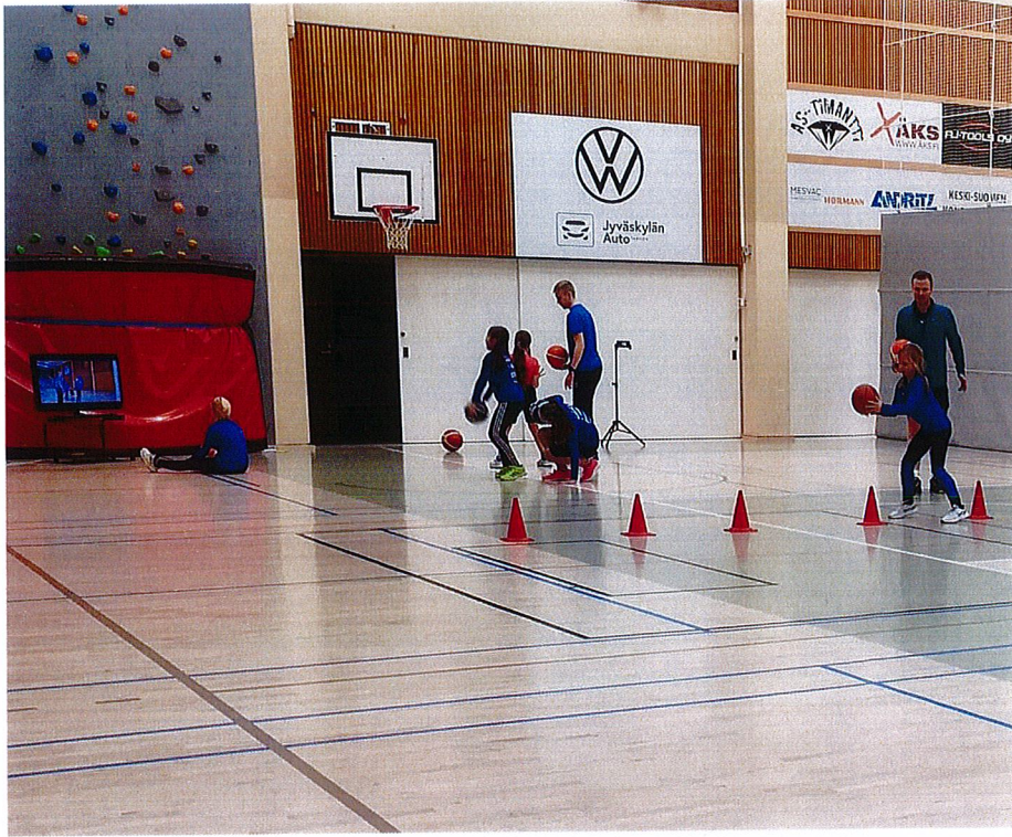
Viivinäytön käyttöä ja harjoittelua mikrotyttöjen harjoituksissa