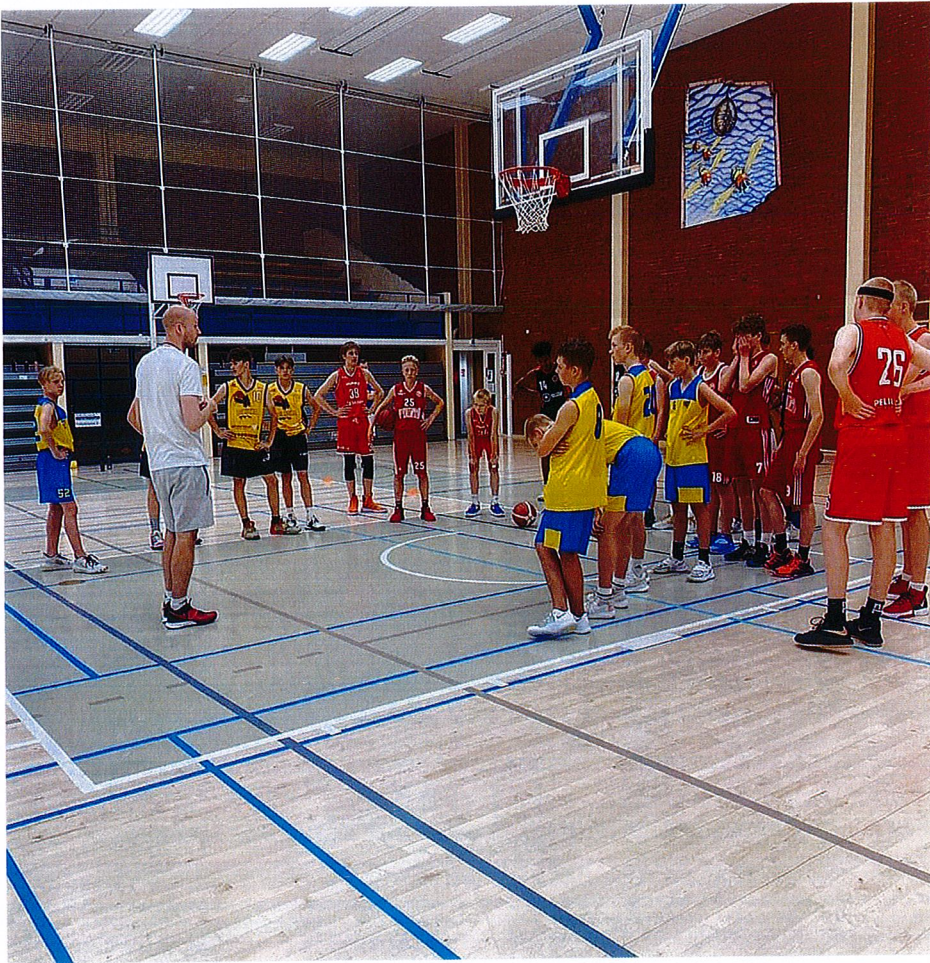
Koripalloliiton SUSI All Stars -leiri Äänekoskella kesäkuussa ja elokuussa