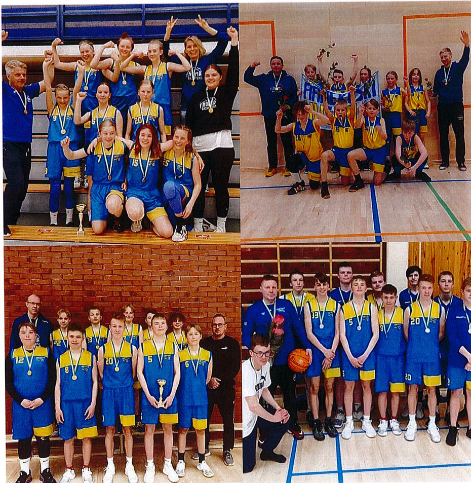
Keskisen alueen mitalistit kaudella keväällä 2021