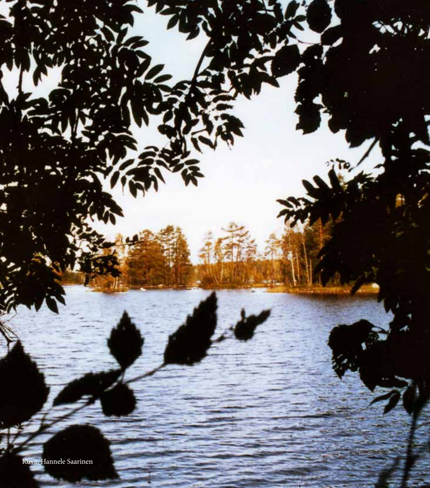
Kuva: Hannele Saarinen