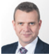
27 | PETTERI ORPO Maa- ja metsätalousministeri, Turku