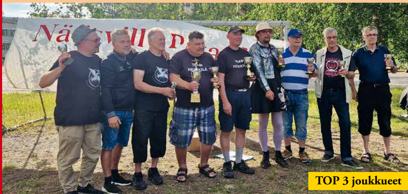
TOP 3 joukkueet