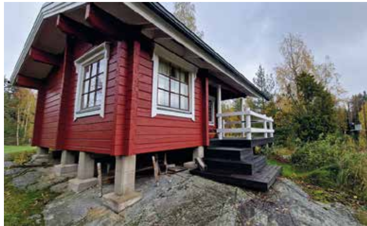
Uutta maalia pintaan sai myös Riihimökki

Jos Parkkuu ei ole paikkana tuttu mutta kovasti kiinnostaisi, erittäin helppo tapa käydä tutustumassa on ottaa osaa kevättalkoisiin! Talkoista ilmoitetaan keväällä.