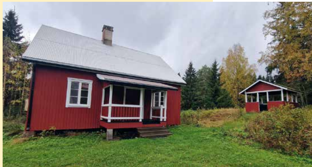
Juuri maalattu Parkkuun päärakennus Parkkuun Pirtti