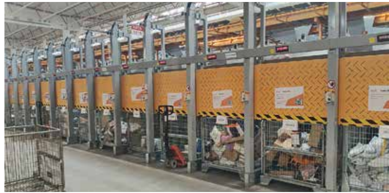
Automaattiluisu, jossa käytetään lehtihakkeja, pabvikaulusrullakoiden sijaan. Rajallisen työskentelytilan takia yksiköt vaihdetaan manuaalisella pumppukärjällä ajettavan sähköisen pässin sijaan.