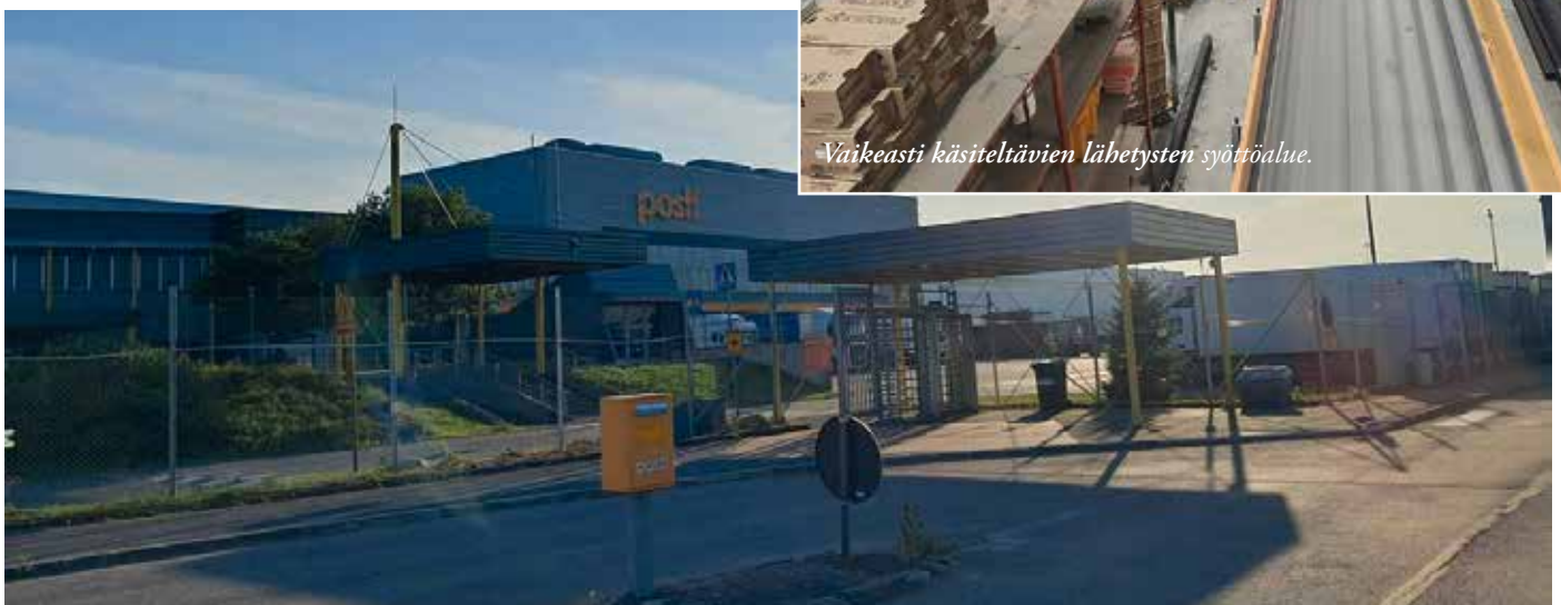
Pääoven edustan pyöröportit ja LoKen julkisivu.