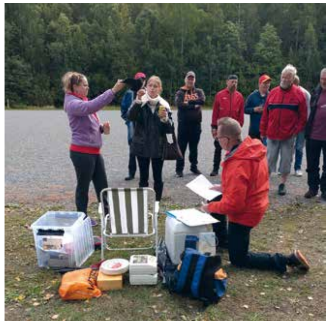
Petankin alussa onnettaret arpoivat joukkueille kisajärjestyksen.