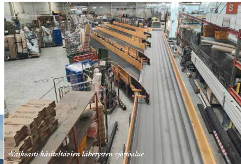
Vaikeasti käsiteltävien lähetysten syöttöalue.