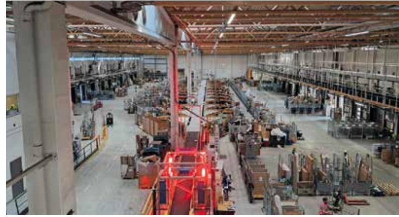
Vaikeasti käsiteltävien -linjaston luisupää ja ja takaseinällä kulku varastohalliin. Oikealla puolella näkyy myös kulkusilta, joita pitkin LoKessa voi liikkua poissa tuotannon keskeltä.