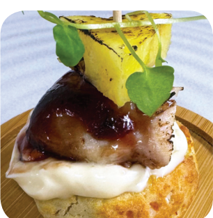
Ohranjyvä Kanaa Talon Takaa: perunarieskaa, vehnäolutmajoneesia, mustaherukkaa, kananrintaa, liekkitettyä ananasta Näsiliinankatu 15