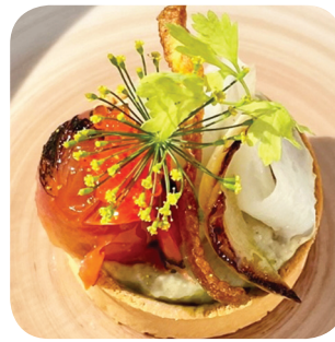
Courtyard Marriott Kitchen&Bar Grill, fenkolia, fenkolipyreetä, hiili, loh-ta, tomaattia, jalopenoöljyä, tilliä (L) Yliopistonkatu 57