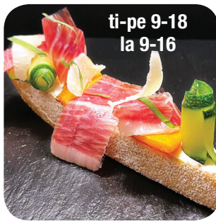
Heart of Spain ti-pe 9-18 la 9-16 Jamon Iberico, tatticremea, kurpitsaa, kesäkurpitsa, lampaanjuustoa Hämeenkatu 19 Kauppahalli