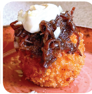
Dining 26 by Arto Rastas Croquette: perunakroketti, hillottua naudanposkea, salottisipulia, aiolia Aleksanterinkatu 26