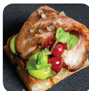
Lynx Bar & Café Briossi, sokerisuolattua ankkua, kirkkomaajoneesia sekä karpalosiirappia Hatanpään valtatie 1 Hotel Ilves