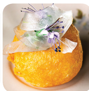
Nonni Parmesan tuulihattu: tartar naudasta, savuvoimajoneesia & fenkolia Tammelan puistokatu 35