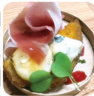
Kumma Bar&StreetKitchen Serranokinkua, munakoisoa, Saint Agur homejuustoa, päärynää Hallituskatu 14