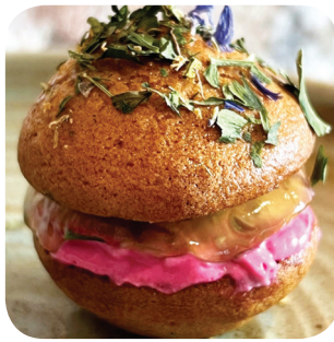
Bistro Henriks Omena-punajuuri whoopie (L) Satamakatu 7