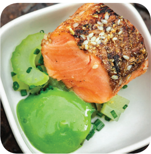
Haarla Ravinteli Sokerisuolattua kirjolohta ja inkivääri-pikkelöityä kasviksia Pellavantehtaankatu 14