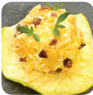
Herkkujuustola Talon jogurtti-labneh, maapähkinää, kuivattua karpalaa, omenaa (VL,G) Kuvrosentie 3, Sastamala