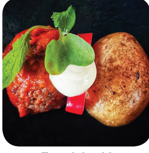
Tom's Grill Kaleva Ylipysää possun niskaa käärittynä riimihäkkään omenalehikäsillä Pellervonkatu 9