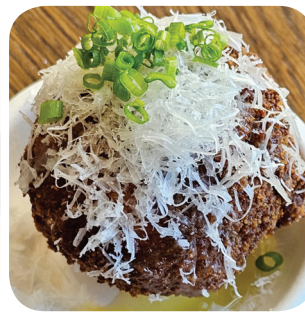
La Famiglia Arancini Nduja, Fior Di Latte & Lemon Vinaigrette (G) Teiskontie 1