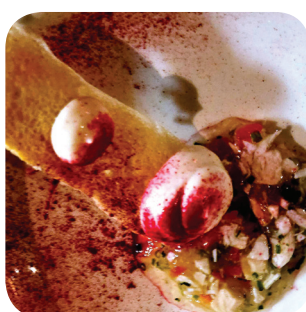
Los Pollos Grill & Bar Aspec de pollo con pan de cristal y aioli: kana-aladobia, katalonialaista hapanjuurileipää ja aiolia Aleksanterinkatu 20