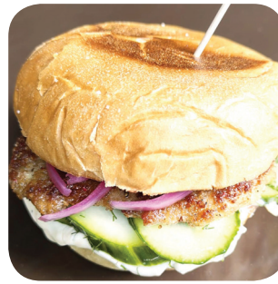
Shooters Bar Saaristonappi, yrttijuurejuusto ja salami Sorinkatu 8