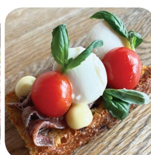
Sailor's Bar & Grill Päränada con salsa bandera: päramätsi kohtaa empanadan ja salsa banderan Hatanpään valtatie 4