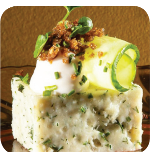
Laterna Haukea, sitrusmajoneesia, pikkelöityä kurkkua ja ruiscrumble. Sis. runon (L) Puutarhakatu 11