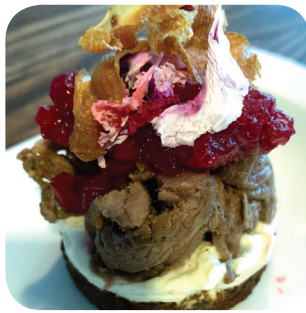
Astor Ravintola Poroa, puolukkaa ja palsternakkaa Aleksis Kiven katu 26