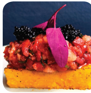
Guru's Kitchen & Bar Sahramipolentaa, "Vatki"-ezmeä ja cavi-arttia (VE/G) Aleksis Kiven katu 15