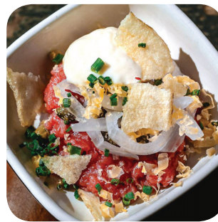
Huber Ravinteli Huberin tartar, goudaa, keltuaista ja perunaa (L,G) Aleksis Kiven katu 13