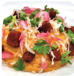
Holvin Piha Savupaprikahummusta ja paahdettua chorizoa, manchego-juustoa (L, G) Kauppakatu 10 sisäpiha