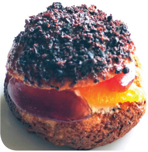
Aisti Ravitsemisliike Vermut 2.0: Vermutti, appelsiini & oliivi (L, saa G) Hallituskatu 19