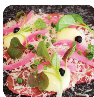
Puisto Nokkosvohveli, osterivinkasta, karamellisipulia ja vilhojuustoa (L) Hämeenkatu 14A Koskipuisto