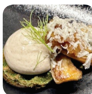
Saivo Kitchen & Bar Etikkaa, kuusenkerkkää, perunaa, vuolukermää ja muikunmätää (L, G) Ratapihankatu 54 Hotel Lapland