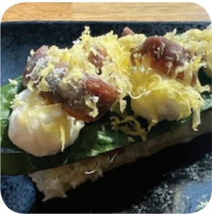
Sokos4 Caesar (L, sis. kalaa) Hämeenkatu 21 Sokos 4. krs