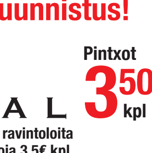
Pella's Koskikatu 7 Härkäcarpaccio: nautan marmorifilettä, goudaa, dijon-kreemiä, punasi-nektariinikompottia (G, L) Koskikatu 7