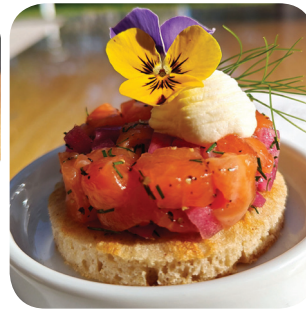
Tuhto Kylmäsavulohitartar, blini ja savustettua smetanaa (L) Yliopistonkatu 55 Tampere-talo