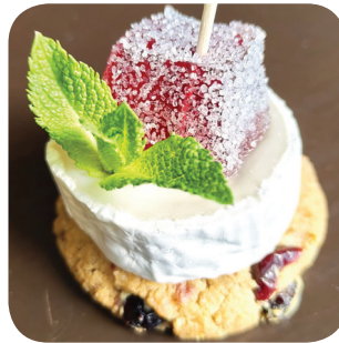
Tapas Bar Inez Biscotti, vuohenjuusto ja Negroni-marmeladi Pellavantehtaankatu 19