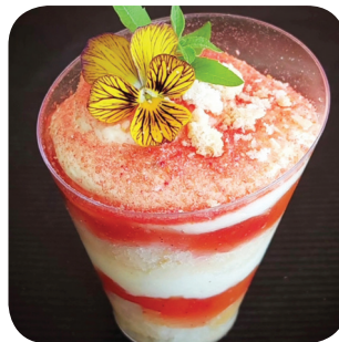
Pella's Café Bellini-tiramisu K18: savoiardi-keksiä, prosecco, mascarponea, persikkanektariinikompottia (G, L) Hämeenkatu 14C