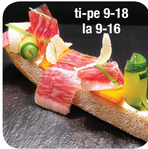
Heart of Spain ti-pe 9-18 la 9-16 Jamon Iberico, tattiCremea, kurpitsaa, kesäkurpitsa, lampaanjuustoa Hämeenkatu 19 Kauppahalli