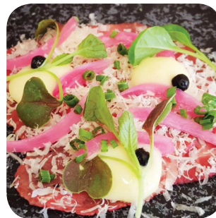
Pella's Koskikatu 7 Härkäcarpaccio: nautan marmorifilettä, goudaa, dijon-kreemiä, punasi-nektariinikompottia (G, L) Koskikatu 7