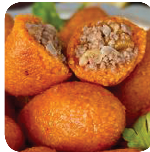
Semafori Välimerellinen arancini: bulguria, lampaanfilee, oliivia, valkosipulikastiketta (saa VEG) Rautatienkatu 25 Rautatieasema