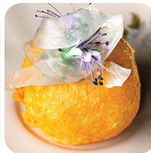
Nonni Parmesan tuulihattu: tartar naudasta, savuvoimajoneesia & fenkolia Tammelan puistokatu 35