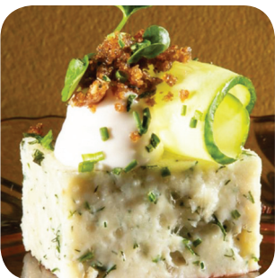
Laterna Haukea, sitrusmajoneesia, pikkelöityä kurkkua ja ruiscrumble. Sis. runon (L) Puutarhakatu 11