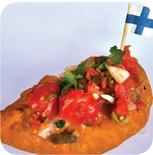
Sailor's Bar & Grill Päränada con salsa bandera: päramätsi kohtaa empanadan ja salsa banderan Hatanpään valtatie 4