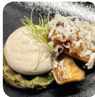
Puisto Nokkosvohveli, osterivinkokasta, kara-mellisipulia ja vilhojuustoa (L) Hämeenkatu 14A Koskipuisto