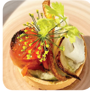
Courtyard Marriott Kitchen&Bar Grill, fenkolia, fenkolipyreetä, hiili, loh-ta, tomaattia, jalopenoöljyä, tilliä (L) Yliopistonkatu 57