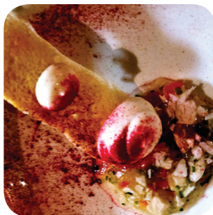
Los Pollos Grill & Bar Aspec de pollo con pan de cristal y aioli: kana-aladobia, katalonialaista hapanjuurleipää ja aiolia Aleksanterinkatu 20