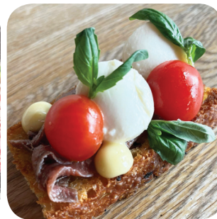
Piemonte Talon hapanjuurifocacciaa, savustettua majoneesia, sardellia, mozzarellaa, kirsikkatomaattia ja basilikaa L Suvantokatu 9