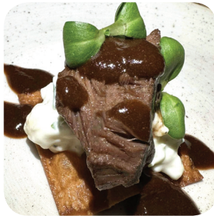
Steam Lakua Poskella: mureaa nautanposkea, lakritsi-punaviinikastiketta ja kukkakaalicoleslawta, rieskasipsi Rautatienkatu 21 Holiday Inn