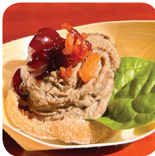
Panmoravintola Plevna Poronvasan maksapateeta ja karpalohyytelöä (L) Itäinenkatu 4