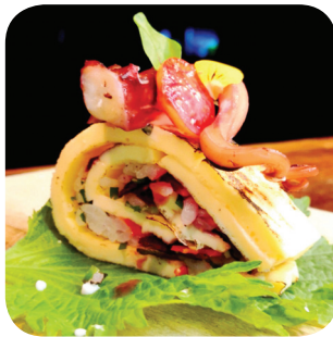
Salsallada Omuraisu ika cheri: japanilainen riisimuraisu, confattua mustekalaa, kirsikkaa shiso-lehdellä Näsiliinankatu 21