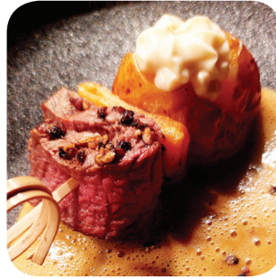
Bodega Salud Pippuripiivi 50 v: naudanfileetä, uuni-perunaa, salaista pippurikastiketta (L) Tuomiokirkonkatu 19