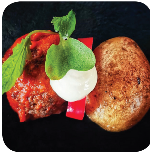
Tampinkoski Luomunaudan lihalla, fritti-perunaa tomaatti-brava kastiketta, paahdettua pikkelijapaprikkaa ja aiolia (L, G) Vuolteenkatu 1