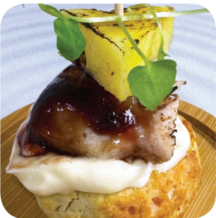
Ohranjyvä Kanaa Talon Takaa: perunarieskaa, vehnäolutmajoneesia, mustaherukkaa, kananrintaa, liekkitettyä ananasta Näsiliinankatu 15