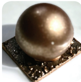
Santé Champagne Bar Gold bubble: kultainen maitosuklaakuori, mustaherukkaa, tummaa suklaamoussea Hatanpään valtatie 2