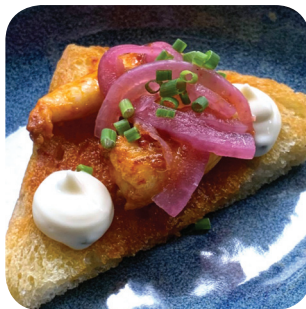
Old Mates Jättiravunpyrstö, grillattua ndujavoita, hapanjuurleipää, sitrusvalkosipulimajoneesia, punasipulia, ruohosipulia Sumeliuksenkatu 18