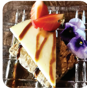
Viinibaari Vinni Siemenleipää, manchegoa (saa G) Hämeenkatu 30