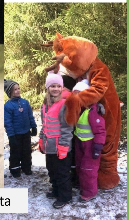
Kuvamuistoja vuosien varrelta