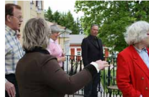
Upeasti entisöity Vuojoen Kartano on Satakunnan merkittävimpiä kulttuurihistoriallisia rakennuksia. Ajan henkeen eläytyneen oppaan johdolla saimme tutustua kartanon vaiheisiin.

Täältä matka jatkui Välimaan perinnetorppaan. Ryhmää oli vastaanottamassa torpan ”isäntäväki”, joka toivotti meidät tutustumaan 1930-luvulle. Sisällä odotti aito hellalla keitetty pannukahvi ja sokerikorput. Jutustelun aikana puheenjohtajan kynä sauhusi, kun hän kirjasi ylös käyttökelpoisia ideoita meidänkin toimintaan. Kahvin jälkeen korintekijä tutustutti meidät pärekorin tekoon. Lähtipä kaksi koria meidän matkaankin. Kotimatalla ehdimme vielä kokea Irijanteen kirkon samankaltaisuuden Merimaskun kirkon kanssa, onhan niillä ollut sama rakentaja! Kyseinen kirkko on Satakunnan vanhin puukirkko, joka on valmistunut 1731. Matkan antina oli oivallus, että aina ei tarvitse matkata kauas löytääkseen uusia elämyksiä. Usein unohdamme, että kotimaassakin on paljon sellaista, mihin emme vielä ole tutustuneet.