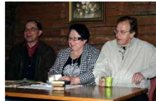
Välimaan perinnetorppassa meille kerottiin torpan elämästä 1930-luvulla. Aidot pannukahvit maistuivat kaikille.