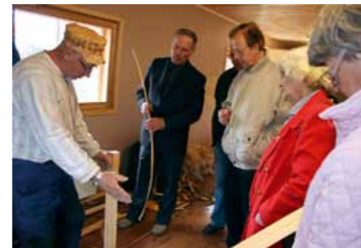
Torpan vieressä olevassa verstaassa näimme, miten pärekorit syntyvät aina päreen teosta alkaen valmiiksi tuotteeksi asti.