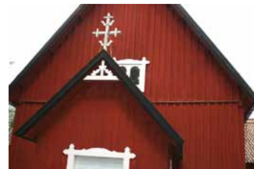
Irijanteen kirkko on rakennettu vuonna 1731. Kirkko kiinnosti meitä, sillä onhan Merimaskun kirkko saman rakentajan tekemä, mikä selvästi näkyy myös kirkon ulkomuodossa.