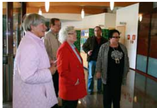
TVO:n vierailutoiminta on osa yhtiön avointa viestintää. Olkiluodon vierailukeskus Sähköä Uraanista -tiedenäyttelyineen on mielenkiintoinen kokemus.