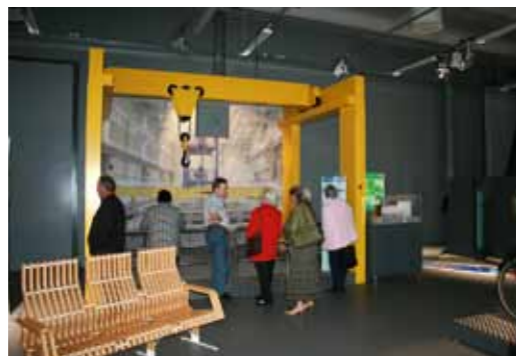
Olkiluodon vierailukeskuksessa pääsimme tutustumaan ydinvoimalaitoksen toimintaperiaatteeseen ja uraanipolttoaineen matkaan kalliosta kallioon. Nappeja painamalla, pyörää polkemalla sekä tutustumalla erilaisiin tietopaketteihin saimme monipuolisen kuvan sähkönsäätämisen ja historiasta.

myös vanhainkotina lähes koko 1900-luvun. Eurajoen kunnan omistama kartano restauroitiin lähes entiselleen vuonna 2005 mittavalla Euroopan Unionin hankkeella.