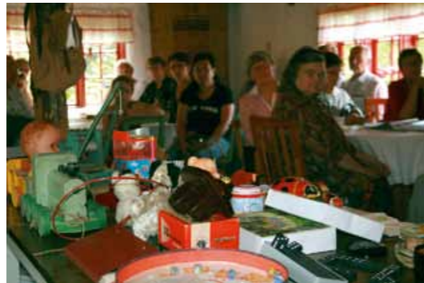
lentokoneet, moottoroidut autot ja ennen muuta erilaiset robotit, jotka vedettiin avaimella käyntiin. Perinteiset lelut säilyttivät silti asemansa lasten suosikkeina.