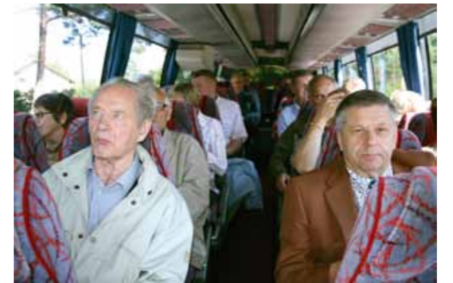
Naantalien Lions Clubi teki vierailun Merimaskuun. Merimasku-Seura toimi isäntänä ja ajelutti linja-autollista kiinnostuneita eri puolilla Merimaskua.