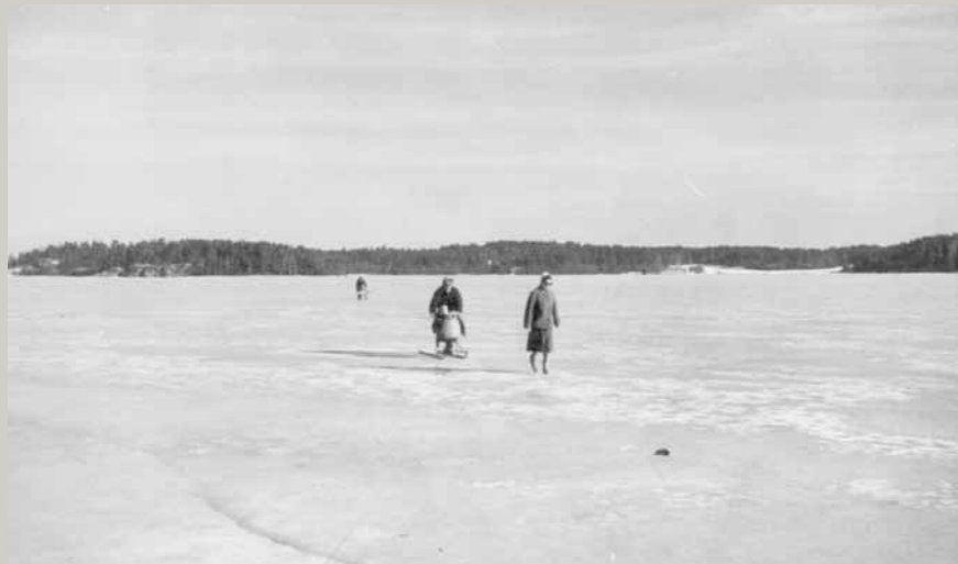
Potkukelkalla kuljetettiin talviaikaan niin kalasaaliit kuin ihmisetkin. Meren jäällä on tunnettava virtapaikat, syvänteet ja matalikot.

maan. Melkoisen mustia lapsia sinä päivänä palasi koululta kotiin. Ei siinä kuitenkaan vanhempienkaan auttanut valittaa asiasta, opettajan sana oli laki siihen aikaan."