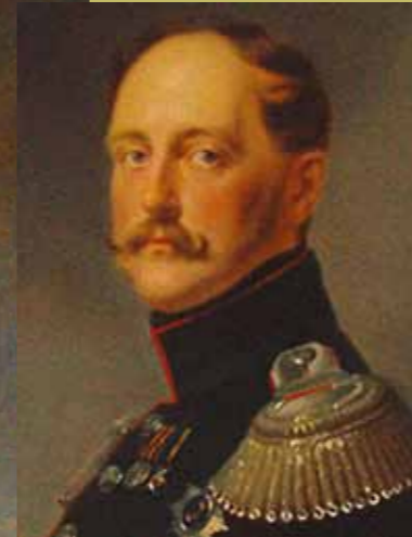
Nikolai I (1825-1855) Nikolai ensimmäisen aikana ei autonomisen suuriruhtinas- kunnan valtiopäiviä kutsuttu kertaakaan.

Aleksanteri I:n vakuutus oli suomalaisille hyvin tärkeä. Kansamme oli järkyttynyt, kun Suomi oli 1808-09 repäistä ikivanhasta valtiotyhteydestään ja liitetty Venäjän valtakuntaan. Keisari kaunisteli tätä tapahtumaa sanoessaan sitä Jumalan johdatukseksi. Itse hän oli aloittanut tuhoisan sodan, jonka aikana Suomi oli menettänyt noin 60 000 ihmishenkeä, sotilaita ja varsinkin sodan levittämiin kulkutauteihin kuollutta siviiliväkeä. Suomalaiset olivat toivoneet, että vihollinen saataisiin torju-