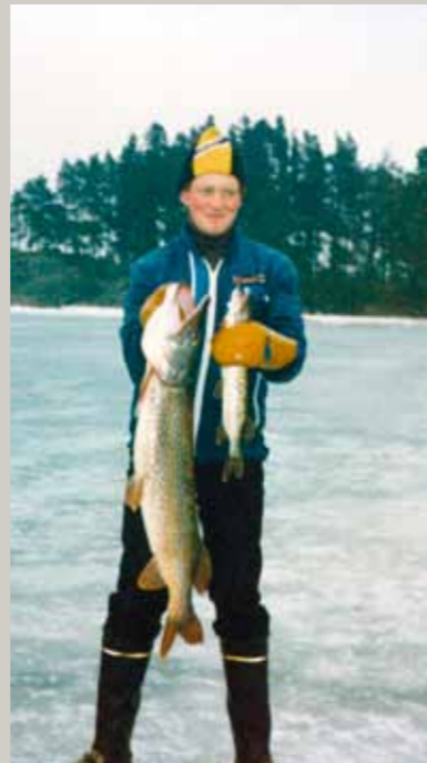
Kalastus ei nuorillekaan ollut mikään harrastus, vaan sillä saattoi kerätä omia taskurahoja. Kuvan hauki kartutti komeasti nuoren miehen moporahastoa.