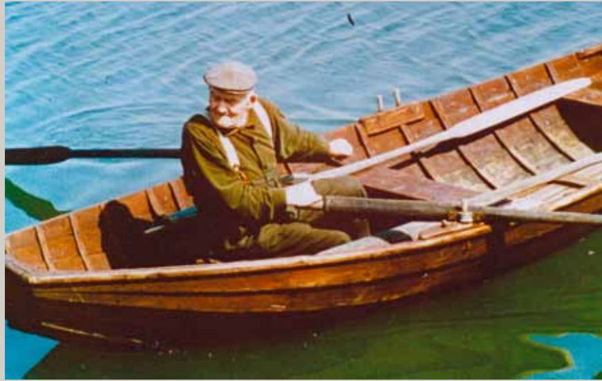
Tyypillinen saaristolainen "kaks-vannane", eli vene, missä sekä keula, että perä ovat tasaiset.