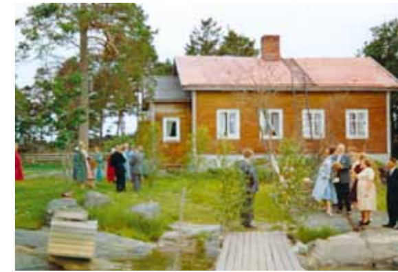
Ristikariin, eli ”Amerikkaan” rakennettu kotitalo, jonne sähköt saatiin vasta niinkin myöhään kuin 1975