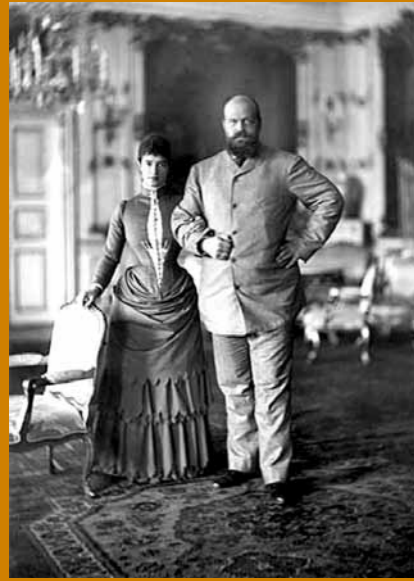
Aleksanteri III (1881-1894) ja vaimonsa Maria. Aleksanteri kolmannen aikaan venäläisyyssyysate alkoi saada venäjällä suurta kannatusta.