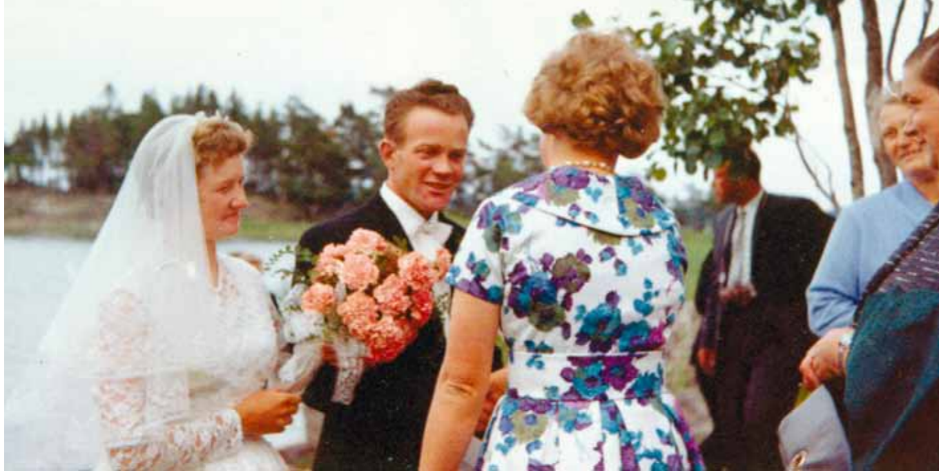
Nuoripari saapumassa omalle saarelleen suoraan Merimaskun kirkosta vuonna 1960

Saaristossa asuville ei vesi ole koskaan ollut este kulkemiselle vaan päinvastoin. Vesitiet ovat aina kuljettaneet ihmisiä niin sulan veden aikaan kuin jäätyessäänkin. Vain kelirikko on jonkin verran hidastanut luotojen asukkeja. Pienet lapsetkin heti, kun vain tuhtolta ovat airoihin ylettäneet ovat oppineet soutamaan ja liikkumaan merellä.