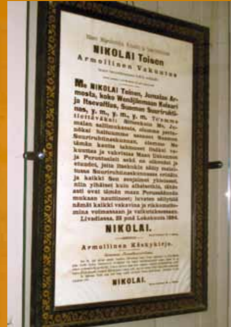
Nikolai toisen (1894-1917) kautta leimasivat Suomen alueella sortotoimet.

sikymmenestä toiseen sisäisesti itsenäisenä maana, jota sanottiin yleisesti valtioksi. Sen riippumattomuutta kuitenkin rajoitti, että Suomessa säädetty laki tai asetus tuli voimaan vasta keisarin allekirjoittamana. Virallisenä kielenä ei ollut venäjä vaan ruotsi ja vuodesta 1863 lähtien myös suomi. Venäläiset eivät päässeet Suomen valtion virkoihin paitsi kenraalikuvernööriä, joka oli keisarin edustaja, eivätkä he saaneet harjoittaa mitään elinkeinoa ilman suomalaisen viranomaisen lupaa. Venäläisiä muuttikin Suomeen vain muutamia tuhansia. Venäjän sotaväkeä oli Suomessa paljonkin, mutta sen katsottiin olevan Suomen turvana vihollisia vastaan.