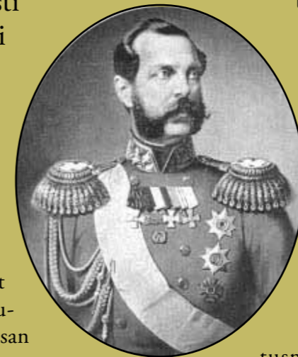
Aleksanteri II (1855-1881) Aleksanteri toinen oli Suomessa erittäin suosittu

moitettu keskiajalta lähtien valtakunnan lain 'kuninkaankaassa'. Vuodesta 1611 sen korvasi ensin Kustaa II Aadolfin antama hallitsijanvakuutus ja vuodesta 1634 lähtien halli-