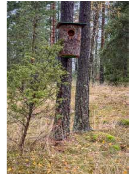
Uutun alla on hyvä olla tasaista maastoa. Poikaset hyppäävät pesästä jo seuraavana päivänä kuoriutumisen jälkeen ja suuntaavat emonsa saattamana kohti rantaa.

Sijoituspaikkaa harkitessa on hyvä ajatella poikasten lähtöuutusta. Ulos hyppäävien poikasten reitin tulee olla selvä, ei oksia edessä eikä kivikkoja alla. Uuttu on hyvä sijoittaa varjoon tai puolivarjoon, jolloin kesän kuuma auringonpaiste ei liikaa kuivata sitä.