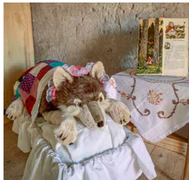
Punahilkka-sadusta tuttu Iso Paha susi turvassa nukkui näyttelyssä päiväunia tilkkupeiton alla täysin tietämättömänä nykyuutisoinnista.