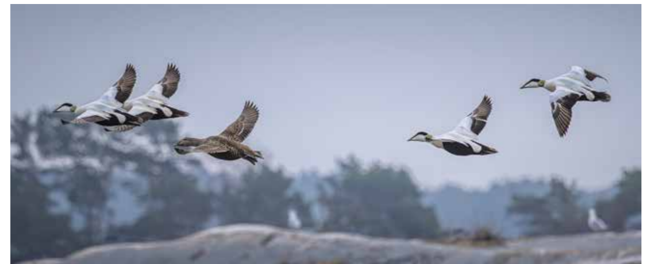
Entisaikanaan merimaskulaiset ovat käyttäneet haahkakoirasta nimeä kalkas ja naaraasta haha. Kuvassa neljä koirasta ja yksi naaras.