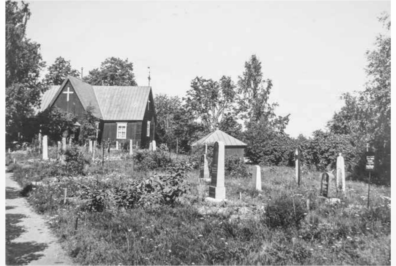
Merimaskun kirkko ja hautausmaa vuonna 1917.