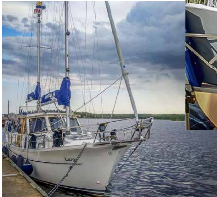
Intohimoisten purjehtijoiden Nauticat.