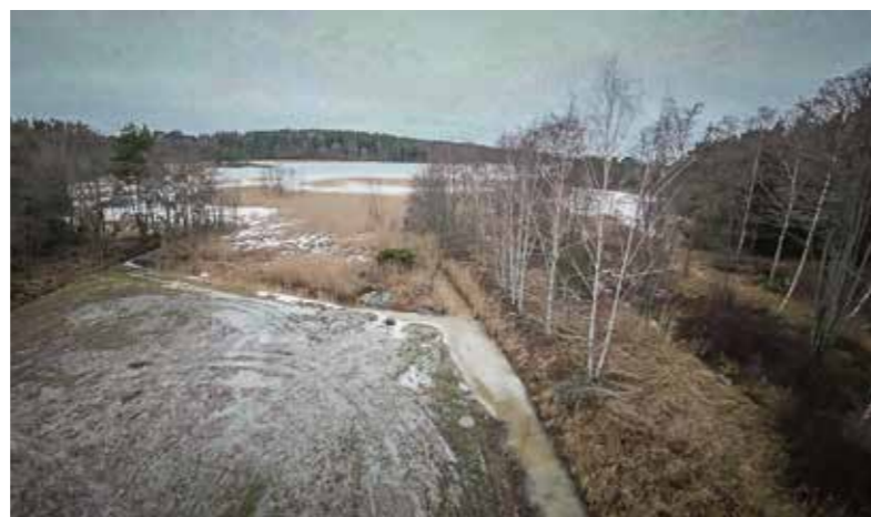
Tyypillinen laskuoja suoraan pelloilta mereen. Merimaskun Iskola tammi-kuussa 2025.

Olin jälleen kuuntelemassa tilaisuutta, jossa lopputulema tuntui olevan, ettei mitään voida tehdä: ei ole rahaa ja haaste on liian suuri. Ja nekin hankkeet, jotka oli jo käynnistetty, kaatuivat mielestäni mitätöimisiin pikkuseikkoihin. Tästä turhautumisesta syntyi päätös ryhtyä tekemään sitä kuuluisaa jotain.