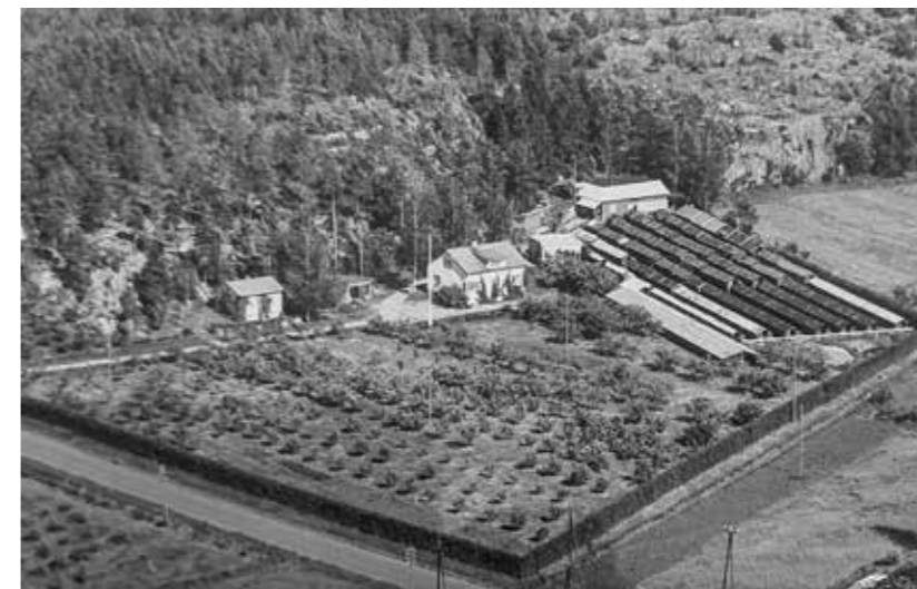
Paavolan turkistarha.