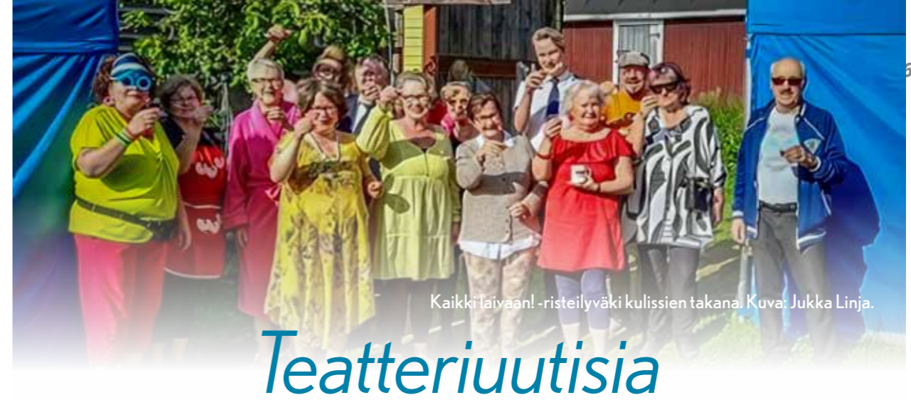
Kaikki laivaan! -risteilyväki kulissien takana.

Olen seurannut läheltä Merimasku-Seuran aktiiveja ja arvostan kovasti heidän tekemäänsä työtä kylämme hyväksi. Kun minua pyydettiin hallitukseen, tunsin velvollisuudekseni olla avuksi. Muista harrastuksista mainittakoon vanhan talon kunnossapito, sulkapallo, lenkkeily ja uudelleen aloitettu haitarin soitto.