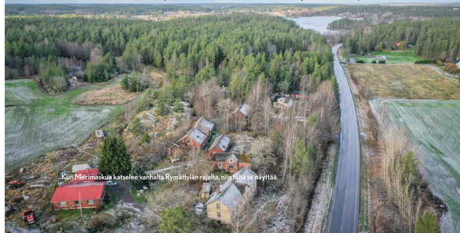
Kun Merimaskua katselee vanhalta Rymättylän rajalta, niin tältä se näyttää.

Silloin yli kymmenen vuotta sitten kuntaliitoksen myötä Rymättylän ja Merimaskun seurakunnille lankesi paikallisen identiteetin ylläpitäjän rooli muiden paikallisten yhdistysten kanssa. Jos tästä Naantalin käynnistämästä kylmästä prosessista jotain positiivista löytyy, niin ainakin tässä on hyvä syy pohtia, kuinka tärkeä tekijä seurakunta yhteisön vahvistajana on.