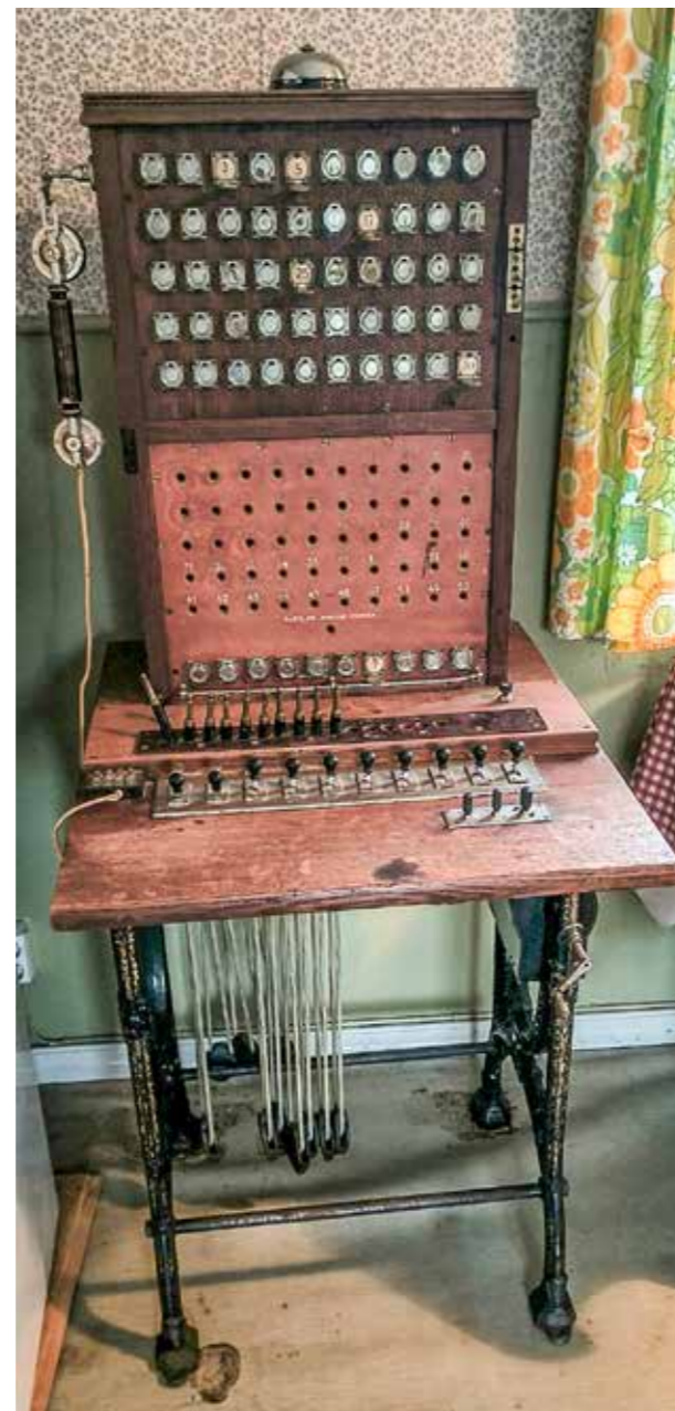
Lierannan vanha keskuspöytä.

Kirjoitus on alun perin julkaistu Viestimies-lehden numerossa 4/2002.