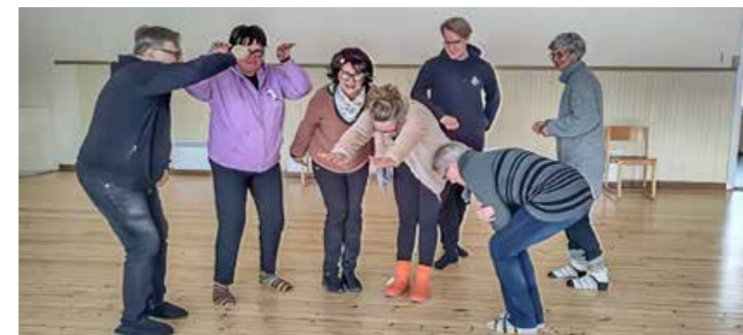
Harjoitukset alkoivat Maamiesseurantalolla.