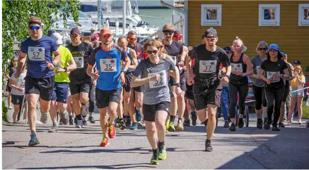
Suvihölkän startti.