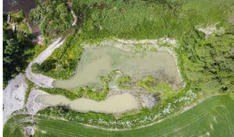
Toteutettu kosteikko, Karhujärvi kesällä 2022.

Merimaskulaiset tietävät, mikä on puhtaan ja elinvoimaisen Saaristomeren merkitys. Se on osa identiteettiämme – elinympäristömme ja monille myös toimeentulon lähde.