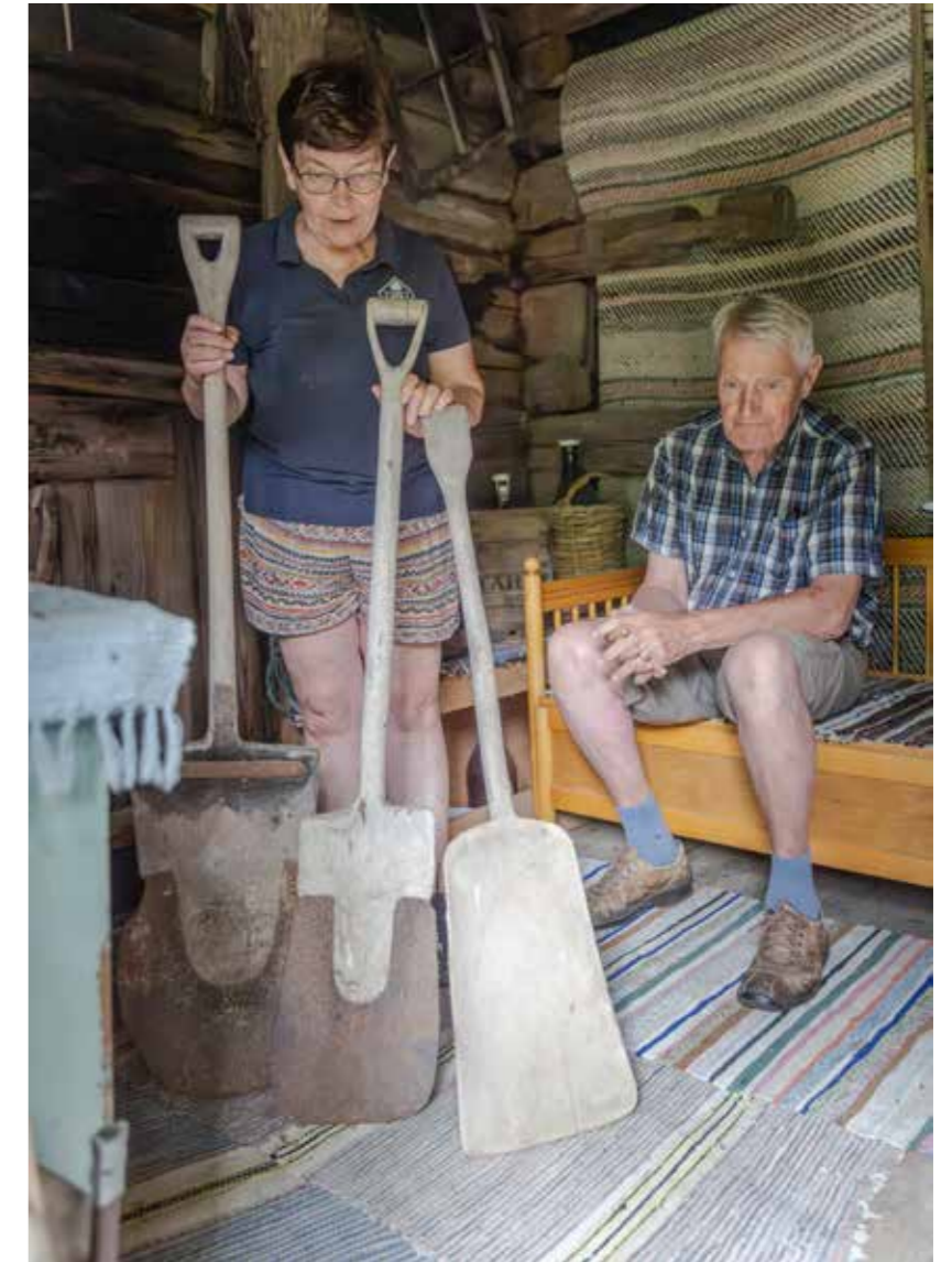
Savusaunan eteisessä voi ihailia ja ihmetellä esineitä eri aikakausilta.