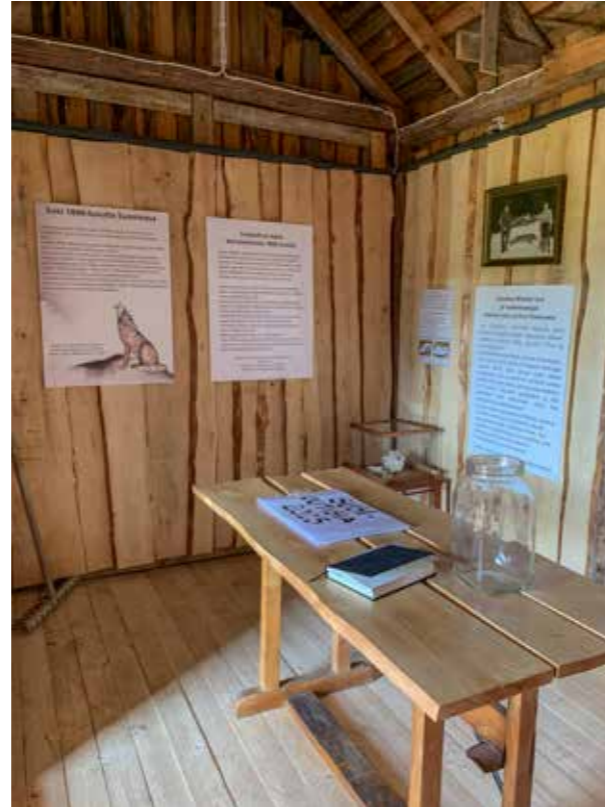
Näyttely oli rakennettu kuva- ja tekstitauluin ja oli mukana myös suden kallo ja siitinluu.

Myötätuulta Merimaskussa 26/2014 ja 11/2000