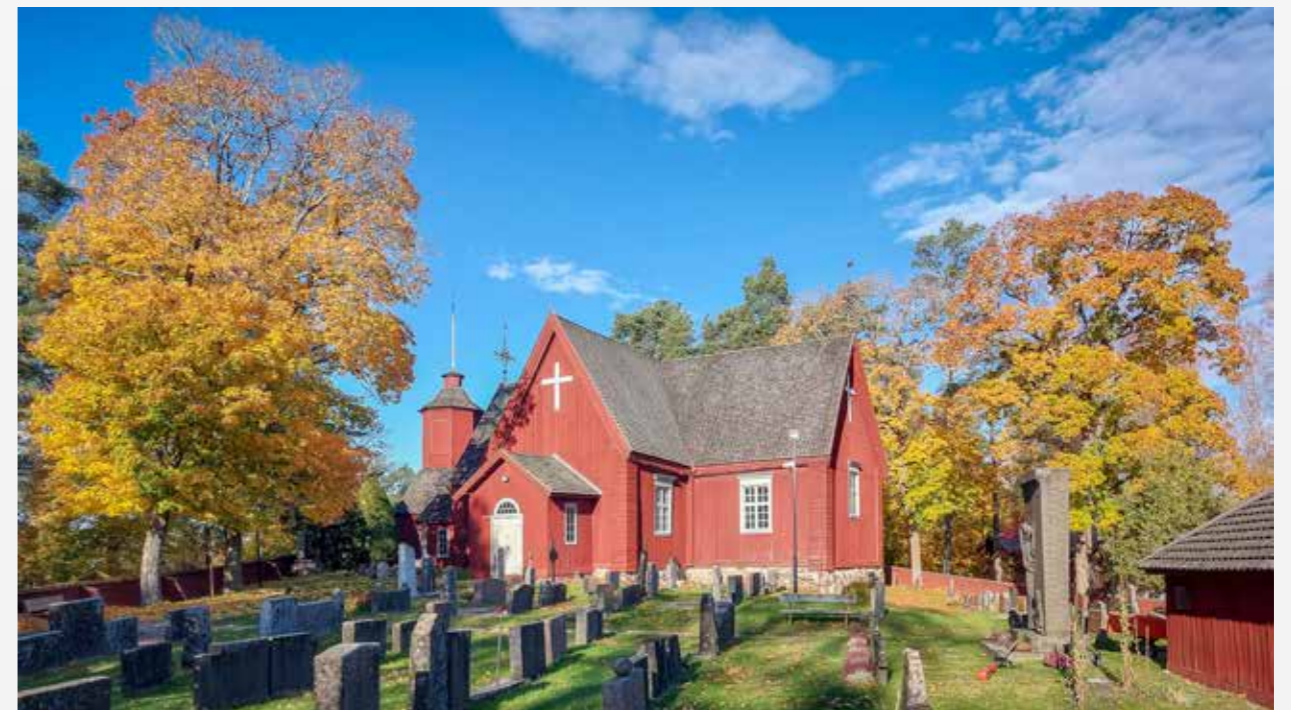
Merimaskun kirkko, tapuli, hautausmaa ja Maskulinin kappeli syksyn 2025 väreissä.