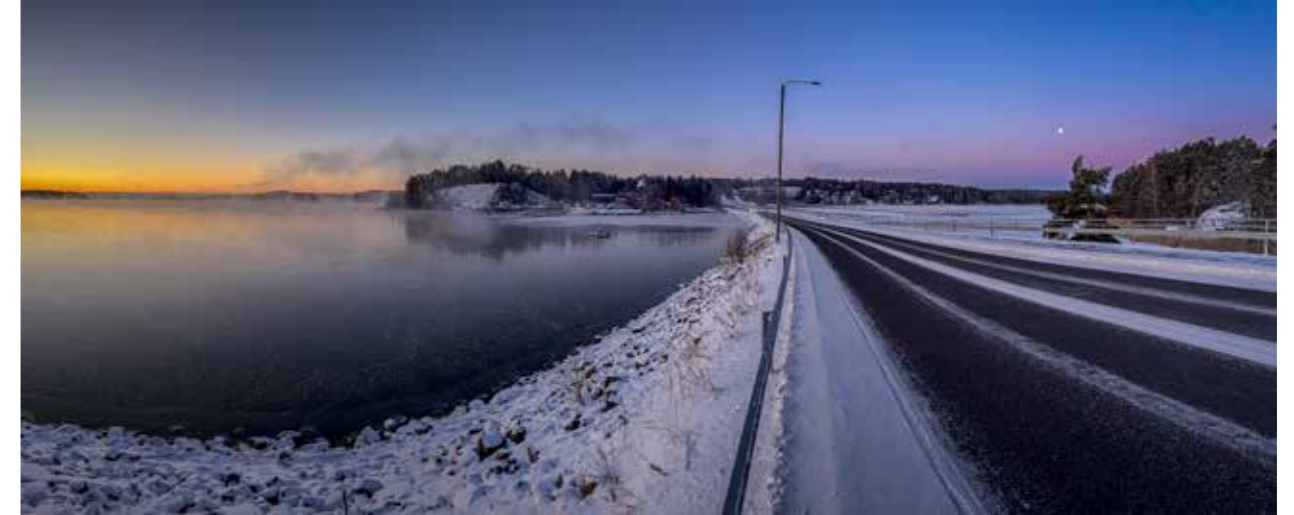
Särkäsalmen aamu tammikuussa 2026.

Kaikilla meillä on mielessä tapahtumia, jotka jaksottavat muistikuviamme menneestä. Olin vielä melko tuore yrittäjä, kun jäin leskeksi – siitä tuli oman elämäni vedenjakaja. Sanotaan, että tyhjällä tilalla on tapana tulla täytetyksi ja että joidenkin ovien sulkeutuminen antaa mahdollisuuden avata uusia ovia. Tänä vuonna tulee kuluneeksi kymmenen vuotta siitä, kun avasin uuden oven Merimaskuun. Silloin yhdistimme kahden lesken taloudet ja minusta, paljasjalkaisesta turkulaisesta, tuli merimaskulainen. Tyhjän tilan täyttivät yhteiset harrastukset, koirat ja ystävät.