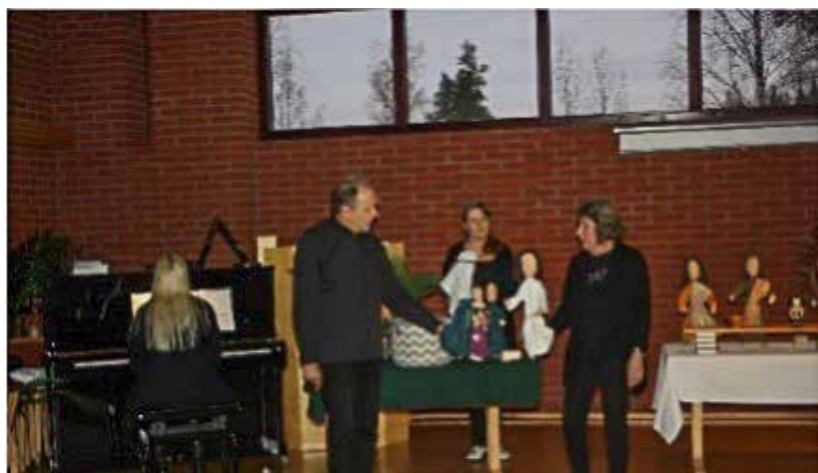
Nukketeatteri ILO esittää.