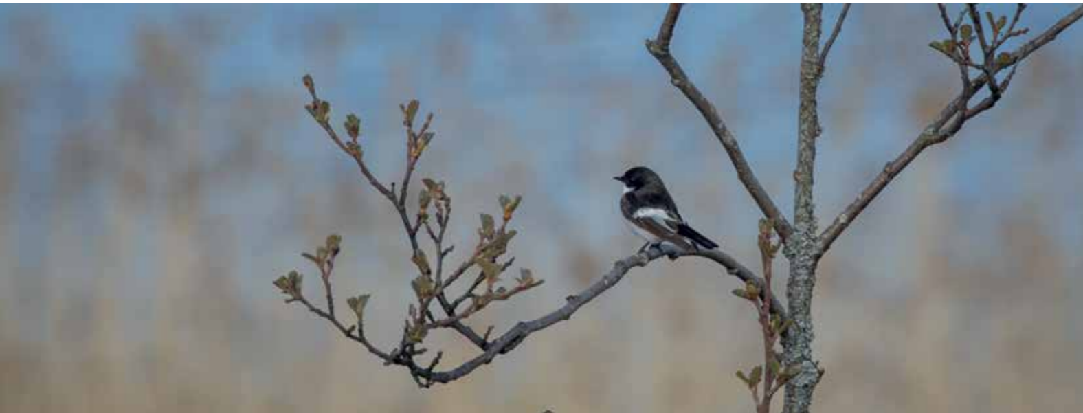
Kirjosiepon laulussa voi kuulla säkeet: "Tule, tule Viipuriin, Viipuriin..."