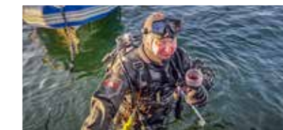
Epätavallista luksusta! Kirjoittaja onnistuneen sukelluksen jälkeen.

Ryhmäämme kiinnostaisi kuulla lisää aluksen historiasta, mikäli tämä julkaisu tavoittaa siitä tietävän.