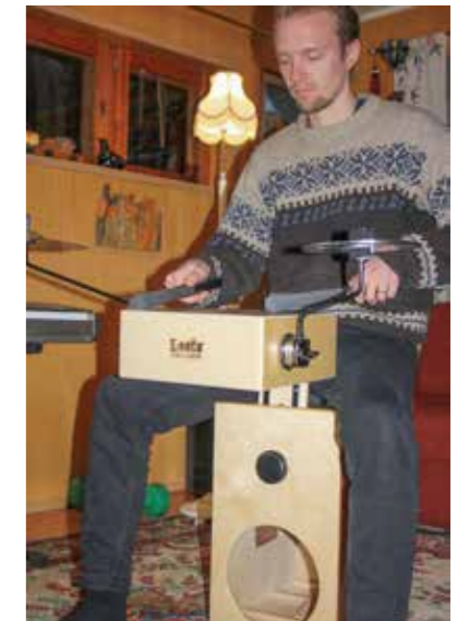
Mies ja loota.