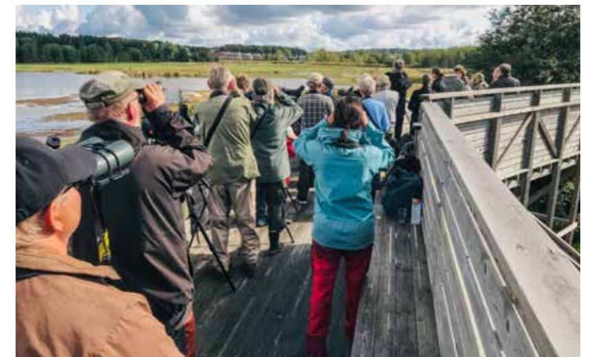
Lintuharrastus on Suomessa erittäin suosittua. Tässä seurataan syysmuuttoa Raisionlahden lintutornissa syksyllä 2023. Raisionlahdella havaittiin tuona päivänä mm. 15 muuttavaa mehiläishaukkaa, yksi tundrahammi, viiksitimalparvi ja kymmeniä muita lajeja. Tiedot: tiira.fi

Ursula Hyrkkänen