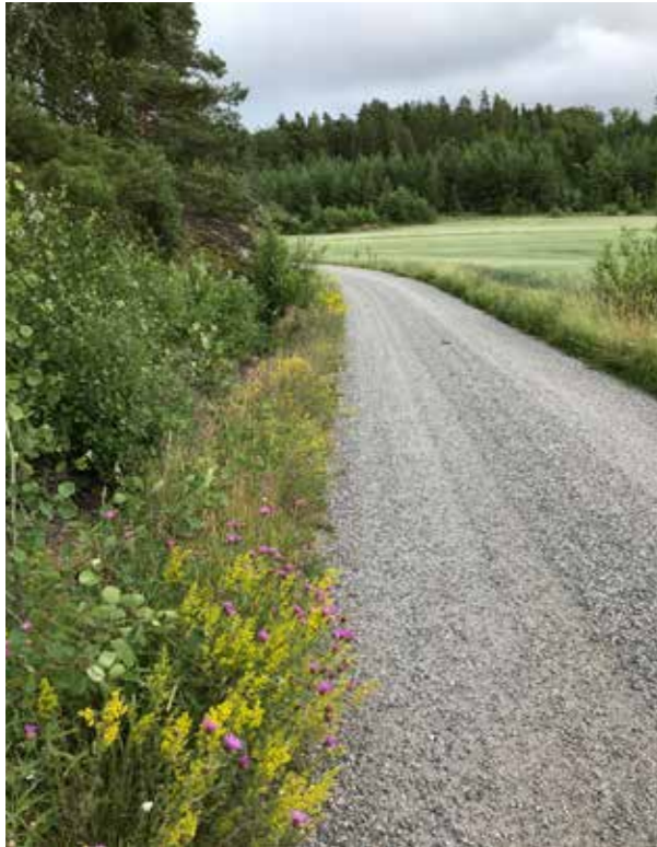
Kukkivat tien- ja pellonpienareet ovat osa kulttuuriympäristöä ja samalla viimeinen turvapaikka monille ketokasveille. Ne myös tarjoavat runsaan ruokapöydän pölyttäjille.