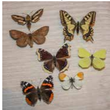
Vasemmalta oikealle: matarakii- täjä, ritariperhonen, mäntykeh- rääjä, suruvaippa, sitruunaperho- nen, amiraali ja auroperhonen.

nen perhosten kautta. Ja huomaa: Suomessa perhosia on noin 2 300 erilaista. Vertailuna vaikkapa Mauri- tius, jossa on vain 42 eri perhoslajia.