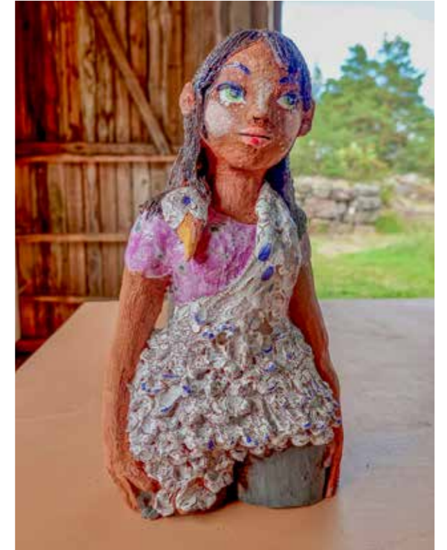
Maisa Majakan veistos