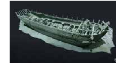
3D-malli hyllystä Priki Regard, Ahven- nanmaa.