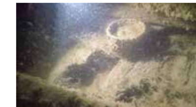
Ruukku Försöket-hyllyn kannella.