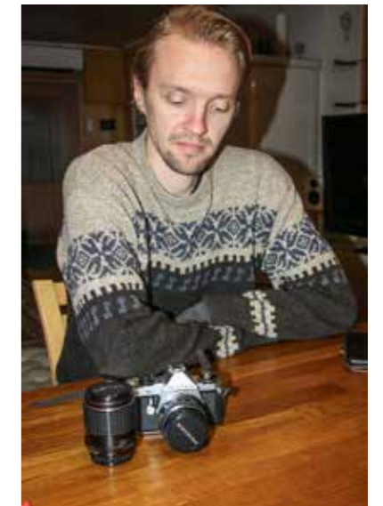
Mies ja filmikamera.

Mustan Kauriin löytää internetin palveluista ja Samin ehkä vielä joskus Merimaskun teatterista ainakin yleisön joukosta, ellei peräti näyttämöllä!