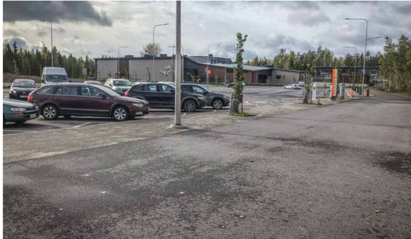
Metsän eliöyhteisö on tehokkaasti tapettu peittämällä se asfaltilla. Musta asfalttikenttä ei ole myöskään ihmiselle viihtyisä ympäristö, ja suorastaa tukalaksi se muuttuu kuumina kesäpäivinä. Herää kysymys, ketä varten tällaisia asfalttikenttiä suunnitellaan.

rakennusryhmien pienimuotoisuus ja meren ja sekä saarien luomat vaihtelevat maisemat." Itsekin olen kiinnittänyt huomioita sisäsaariston maiseman pienipiirteisyyteen: täällä ei näe avomerta eikä siintävää horisonttia, mutta meri pilkahtaa usein yllättäen mutkan takaa tai metsän läpi, ja vesistö koostuu pienistä aukoista, kapeista sunteista, lahdenpoukamista ja ruokoharjasta. Pienet pellot ja peltosaarekkeet pylväskatajineen, peltojen ja kallionnyppylöiden välitse pujottelevat kapeat tiet ja siellä täällä mäen päällä vuosisataiset talonpoikaisrakennukset hellivät silmää. Lähimaisemaan kuuluu toki myös sisäsaariston monipuolinen elonkirjo.