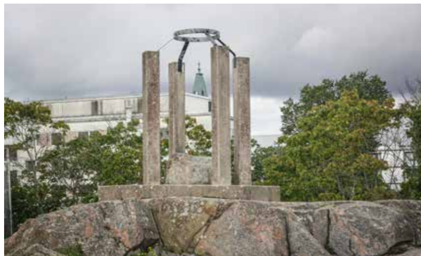
Turussa teloitettiin 1625–1825 kaikkiaan 126 henkilöä, enemmän kuin missään muualla Suomessa. Hirsipuunmäen (nyk. Kerttulinmäki) teloituspai- kalla on muistomerkki, jonka on suunnitellut Esko Hillilä vuonna 1991. Muistomerkissä olevassa laatassa on teksti: ”Kaupungin teloituspai- kka sijaitsee Kerttulinmäellä keskiajalta 1700-luvun lopulle saakka.”