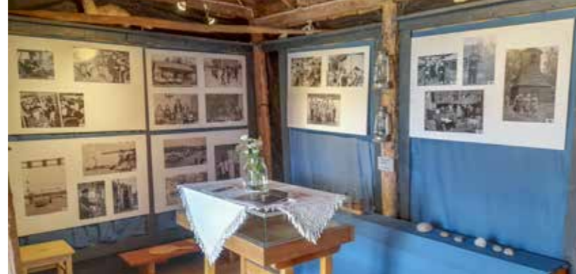
Kesän 2023 näyttely Kollolassa.