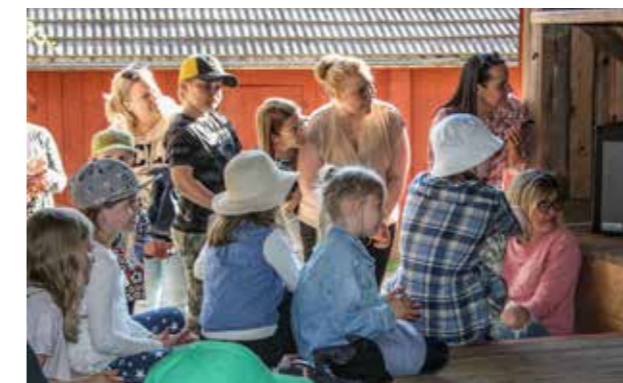
Oppilaiden esitykset kiinnostivat kovasti yleisöä.