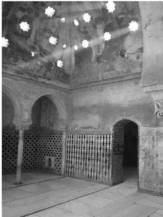
Granadan lähellä olevan vanhan arabialaisen kaupunkilinnoituksen Alhambbran hammanin peseytymishuone. Valo tulvii täälläkin katossa olevista aukoista.

Vasta huolellisen valelun jälkeen on peseytymisen vuoro. Arabeilla