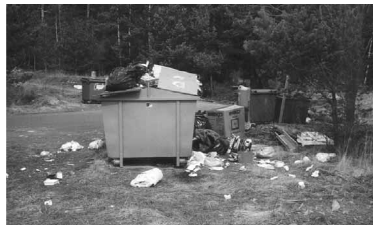
Haahdenniementien "kaatopaikka" pääsiäisen jälkeen 17.4.2001

P.S. Tällä menolla kunnallisen jätehuollon kustannus ja sen mukana vuosittain kannet- tava jätehuoltomaksu tulevat lähivuosina nousemaan rajusti. Tämäkin erittäin surullista, mutta totta. ....