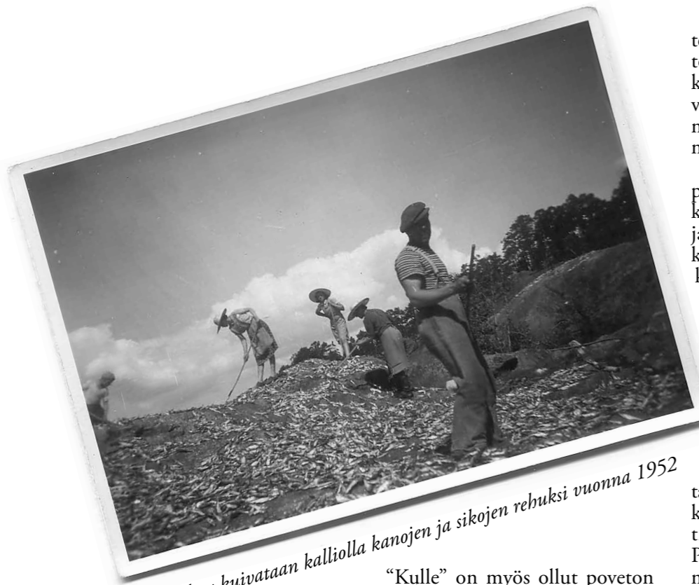
Silakkaa kuivataan kalliolla kanojen ja sikojen rehuksi vuonna 1952

kiviä tai suoraan paulaan sidottuja sopivan muotoisia luonnonkiviä.