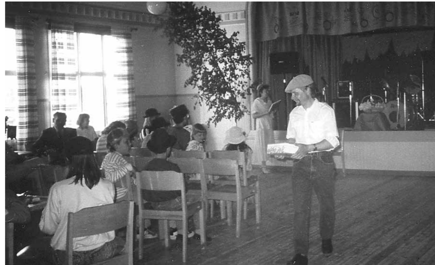
Omakotiyhdistys vietti 10-vuotisjuhliaan Maamiesseuran talolla 1989

Liitto toimii nykyään omakotitalon, rivitalo-osakkeen tai lomakiinteistön omistajan etujärjestönä. Liitossa on noin 43 400 jäsentä ja 210 paikallista yhdistystä. Omakotiliitto on paitsi etujärjestö myös palvelujärjestö. Liiton jäsenet saavat mm. maksutonta laki- ja rakennusneuvontaa ja Omakotilehden neljä kertaa vuodessa. Edunvalvojana