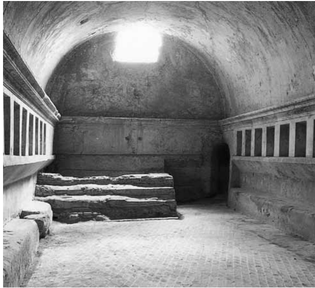
Peräseinällä vuonna 79 tuhoutuneen Pompeijin kaupungin kylpylän höyryhuoneen lauteet, Sivulla näkyvät aukot, joista höyry tulvi huoneeseen

Rituaaliin kuuluu ensin varella itseään vedellä ja vasta sen jälkeen siirtyä höyryhuoneeseen. Valelun jälkeen miehet astuvat pehmeään höyrysaunaan. Lämpöä ei ole paljoakaan enempää kuin ulkona kadulla, mutta kostea höyry tekee siitä miellyttävän pehmeän. Täälläkin kaikki on yltäkyläisen koristeellista. Miehiä istuu ja makoilee leveillä tasanteilla. Jotkut keskustelevat keskenään vilkkaasti. Vaikka täällä ei olekaan suomalaisen saunan harrasta rauhaa, on tunnelma silti hillitympi kuin basaarialueella hetki sitten. Selvästi sauna on arabeillekin muutakin kuin vain peseytymispaikka.