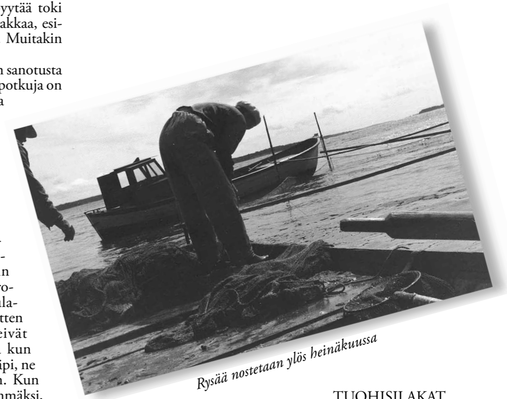
Rysää nostetaan ylös heinäkuussa

Totta onkin, että silakasta saa vaihtelevaa ruokaa satamäärin. Niitä voi muunnella lähes loputtomiin, eikä silakkaan koskaan kyllästy.