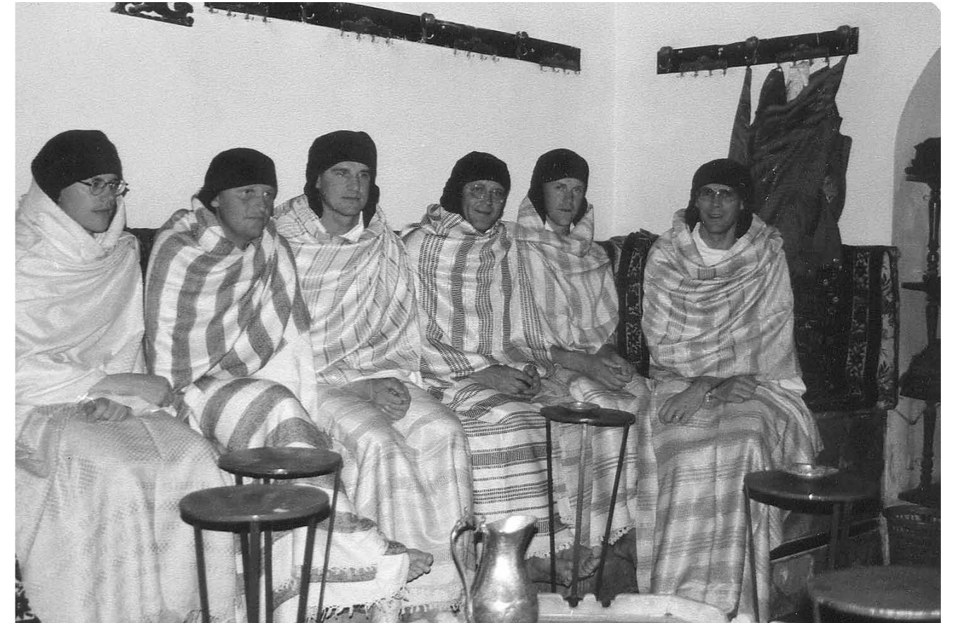
Saunomisen jälkeen tulee huolellisesti varoa kylmettymästä. Miehet odottelevat teetarjoilua peitteisiin kääriytyneinä

Riisuutuminen täällä tapahtuu suurella hienotunteisuudella. Tapoihin ei todellakaan kuulu paseerailla nakuna kaikkien näh-