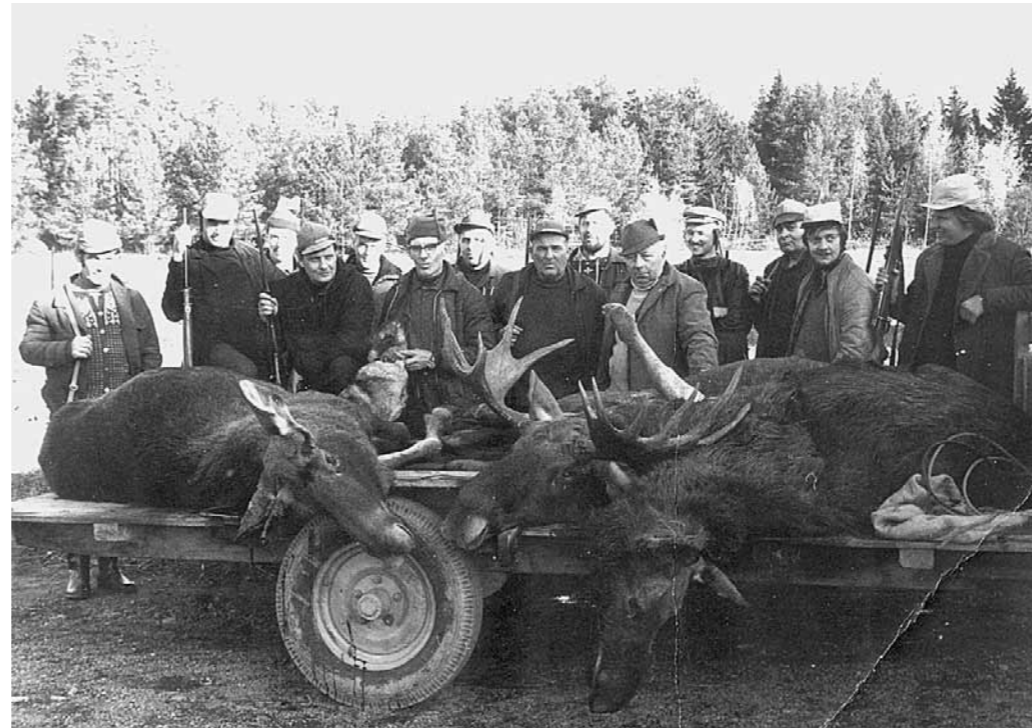
Hirviporukkaa Kustavissa joskus 60-luvulla

Pikkuriista metsälinnut ovat Merimaskussakin olleet tärkeä metsän vilja, mutta erityisesti sodan aikana sen arvo nousi huippuunsa. Ruoasta oli pulaa kaupungeissa ja niinpä saaliin sai helposti myytyä. Kaupungissa oli vakituiset ostajat, jotka odottivat linja-autoa ja kyselivät, josko on riistaa kuskilla matkassa. Jos riistaa löytyi, arvioi ostaja, mitä hän siitä maksaisi ja antoi bussin kuljettajalle rahat toimitettavaksi saaliin lähettäjälle. Metsästäjän ei