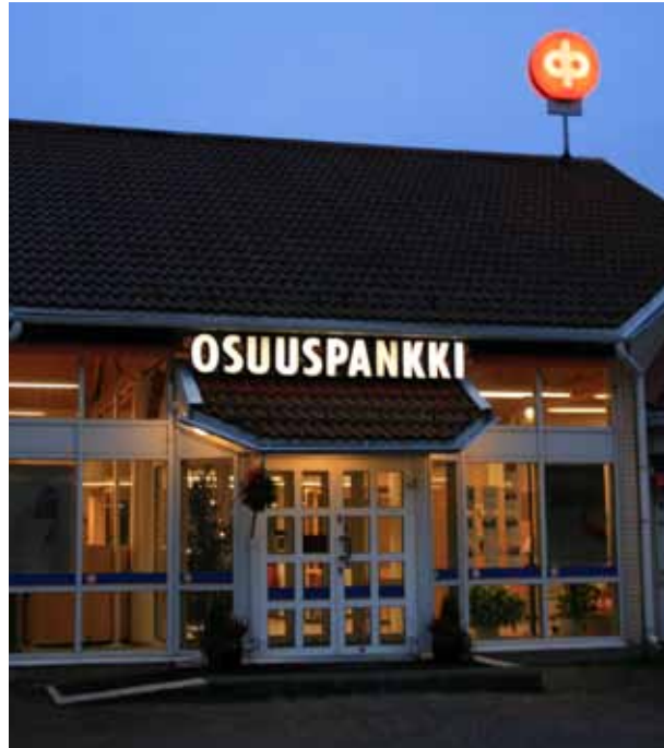
Merimaskun Osuuspankin nykyinen toimitila Särkäsalmella

Tänään Merimaskun Osuuspankki on jo 80-vuotias. Liiketoiminta