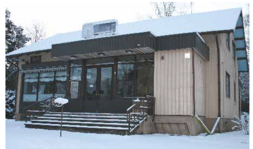
Osuuspankin ensimmäinen oma pankkirakennus Kirkonkylässä. Kuva ajalta, jolloin pankki ei enää toiminut rakennuksessa.

Vuoden 1949 loppuun mennessä Merimaskun Osuuspankki oli myöntänyt lainoja 196 kpl.