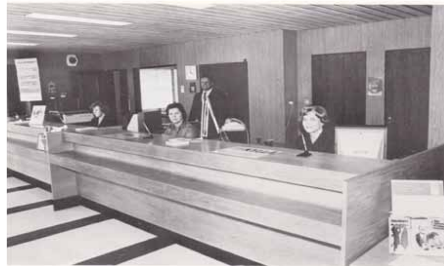
Vuonna 1978 pankkisali kirkonkylän pankkirakennuksessa uudistettiin.

Kun Merimaskun Osuuskassan toiminta vilkastui yhä, niin hallitus päätti kokouksessaan 7.10.1953, että