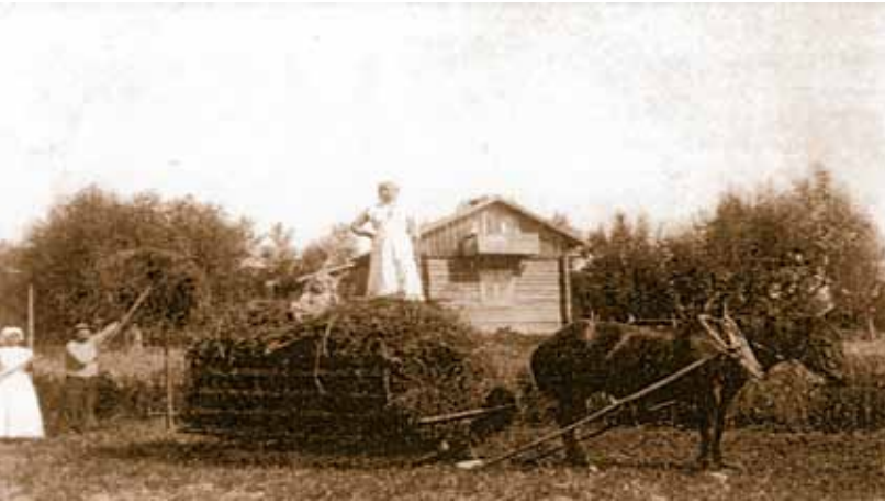
Heinäntekoa Apajan niityllä