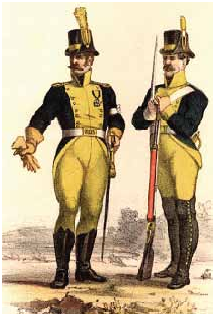
Suomen sodan aikaisia asepuukuja