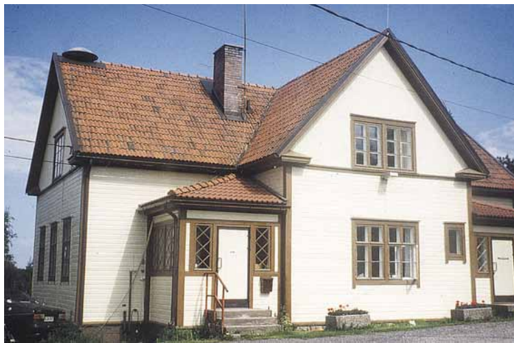
Kunnantalon yhteydessä olleeseen Osuuspankkiin kuljettiin vasemman puoleisesta ulko-ovesta.