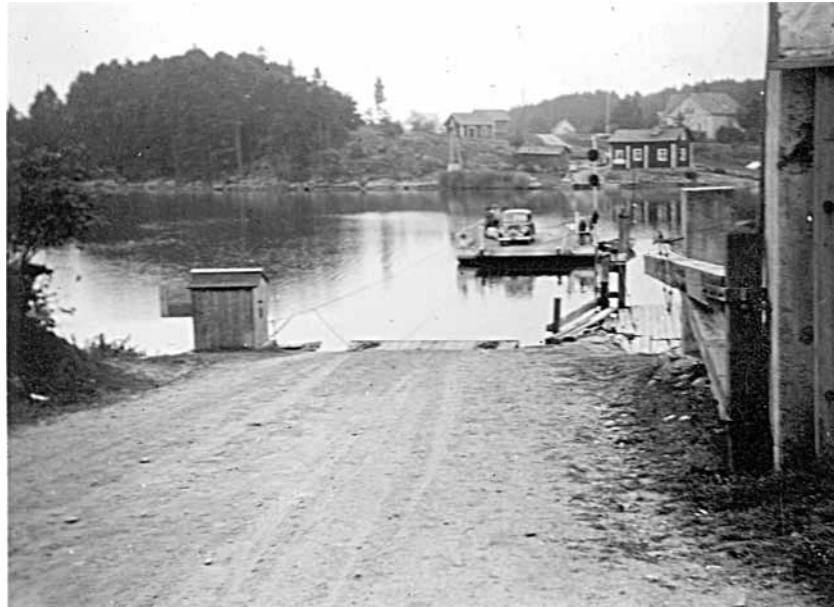
Lossiranta kuvattuna mantereen puolelta. Kuva on ennen vuotta 1956, sillä siinä näkyy vielä lossirannan ensimmäinen "föritupa".

keelleen Merimasku-Seura sai siitä, että tiedotusvälineet niin voimakkaasti kiinnostuivat asiasta. Ensin Aamu-TV otti yhteyttä ja sen jälkeen paikalliset TV:t ja radiot sekä lehdistö halusivat tehdä jutun lossihankkeesta. Vieläkin jotkut toimittajat ovat ottaneet yhteyksiä ja kyselleet, missä vaiheessa hanke on.