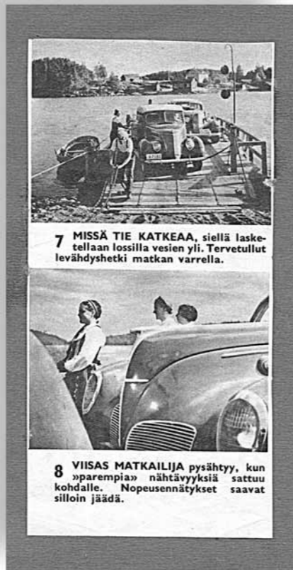
Lehtileike 1950-luvulta osoittaa, että lossit olivat jo tuolloin mielenkiintoinen lisä Suomen automatkailussa.

Ensimmäisinä salmen yli kuljettajina toimivat maanomistajat ja ennen kuin lossien ylläpito siirtyi valtiolle, he huolehtivat myös lossinpidosta. Esimerkiksi tällainen ylikuljetusvelvollisuus oli mantereen puolella sijaitsevalla Vahan torpalla.