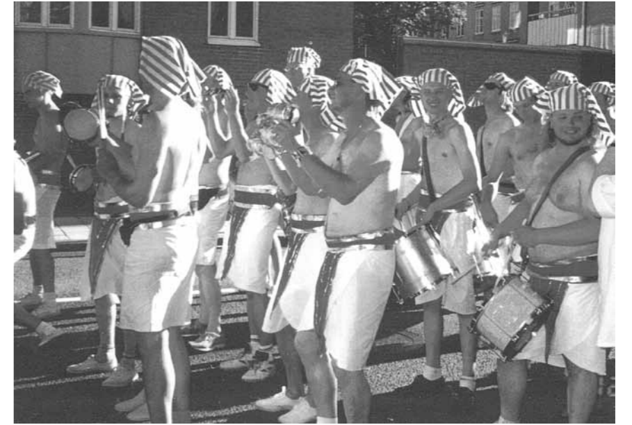
Rumpuryhmä on tanssijoiden sydän ja sielu. Hyvä rumpuryhmä pitää sykkeen korkealla.