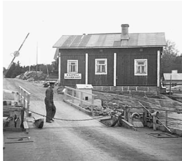
Lossi tulossa rantaan. Lossari on avannut puomin valmiiksi ja valmistautuu avaamaan lossin ketjun, että kyydissä olevat pääsevät jatkamaan matkaansa.

6. Projektityöryhmä sai työnsä päätökseen, mutta nyt odotellaan, että lossikiinteistön ja maapohjan omistussuhteet selviävät ja päästään perustamaan uusi työryhmä, joka